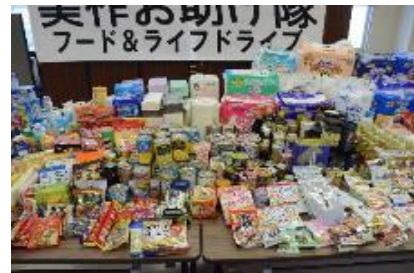
第2回 令和4年1月11日(火)～1月21日(金) 食品・日用品 804品 276kg