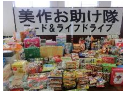
第1回 令和3年8月23日(月)～9月10日(金) 食品・日用品 1,103品 576.5kg