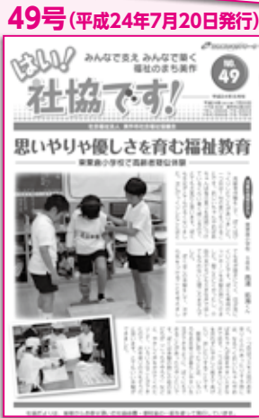
東粟倉小学校で福祉教育