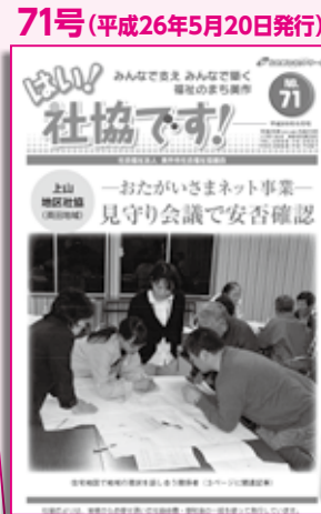
各地域でおたがいさま ネット事業に取り組む