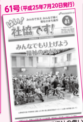
第1回土居地区福祉の集い