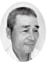
地域福祉活動について