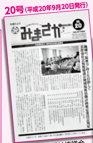
美作市社会福祉協議会 地域福祉活動計画策定 委員会発足