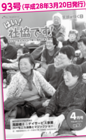
この号から表紙写真が全面に