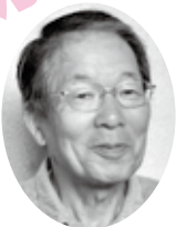
隣近所の助け合い支え合いが必要

社協だより100号記念に当たり日頃感した事を述べたいと思います。作東地域の地区社協活動としては、特におたがいさまネット事業の見守り会議が重要だと考えています。助成期間が過ぎた後も地区で自立して取り組んでいくためには、特定の役員だけが熱心に取り組むのではなく、皆で協力し合って進めていくことが大切です。今後より良い作東地域となるよう、地域全体で助け合いながら、地域福祉を進めて行きたいと考えています。社協だよりが、今後益々地域福祉推進の一翼を担う事を祈念申し上げます。