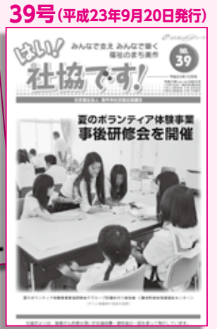
この号から毎月の発行