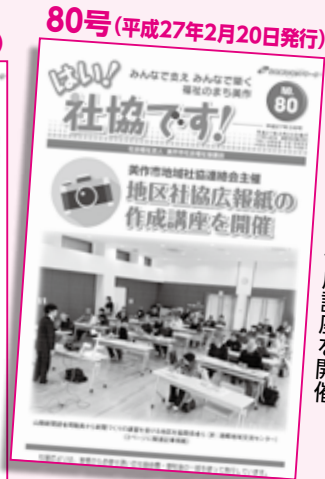
地区社協広報誌の作成講座を開催