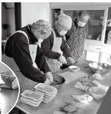
厨房で活躍する男性会員

活動の内容は、みんなで案を出し合い計画をして、年間12回実施しています。活動の特徴は、男性の参加が毎月あり、女性パワーに負けないくらい、楽しく過ごされていることです。具体的には、男性料理教室を年2回実施しており、その日は午前中に栄養委員さんの指導のもと、調