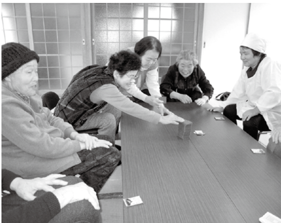
代表を務めるアカシア会の活動の様子