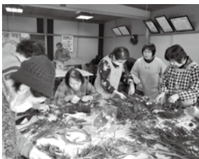
12月 クリスマスリース作り