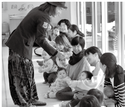
チャーリーさんと参加者