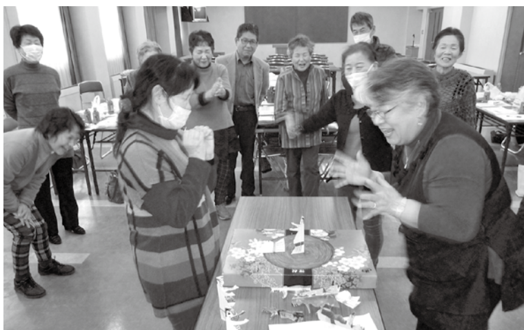
手作り相撲ゲームで対戦し喜ぶ参加者