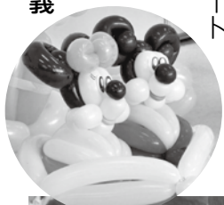
披露されたキャラクター