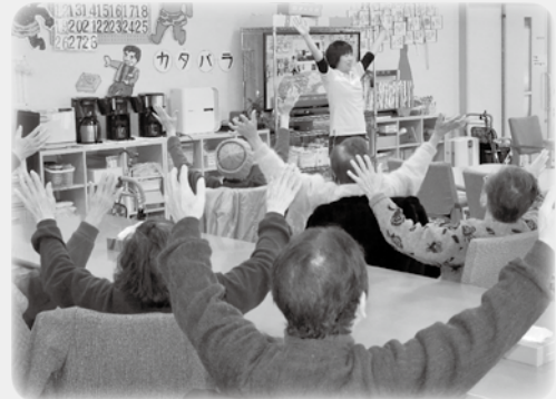
みんなそろって音楽に合わせて体操や認知症予防プログラムを実践しています