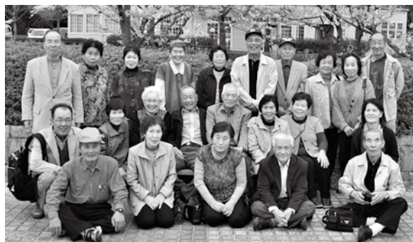
「いつまでも元気で」笑顔の記念写真

理実習をされ、お昼前に女性も参加して、皆で楽しく昼食を頂いています。そんな活動のおかげで、毎月6〜7人の男性の参加があります。