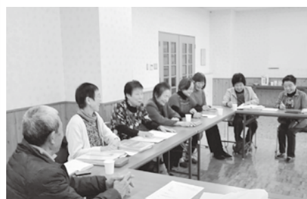
傾聴ボラ「ほがらか会」会議の様子(左側から4人目)

ボランティアだと思います。仲間が増える事は良い事ですのでボランティアを勧めています。