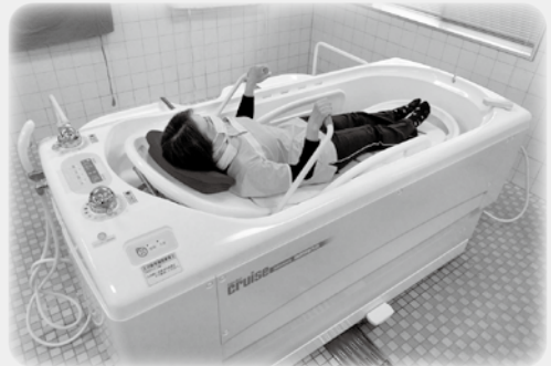
特殊な浴槽で車椅子の方も負担なく入浴できます