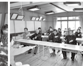
2月 出前講座(田尻病院)