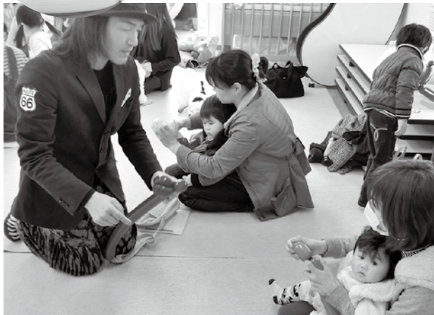
バルーンアートに挑戦する参加者