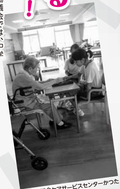
総合ケアサービスセンターかつた

僕は2日間の夏ボラ体験でしたが、たくさんの事を学ぶ事ができました。その中でも、仕事という大変な事でも、誰かが感謝してくれると思うと、とても嬉しくなることや、たとえ自分が疲れて休みたいと思っても、一つ一つの行動が褒めてもらえるという結果に繋がり、今回の経験は将来のためにも、人として成長していくためにも貴重な体験でした。また、この経験はきっとどこかで役立つ時が来ると思います。本当に楽しく自分のためになる2日間でした。