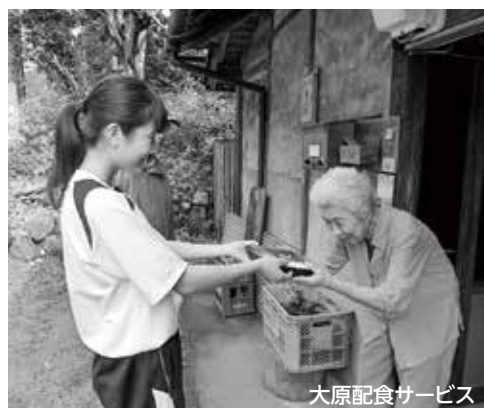
大原配食サービス