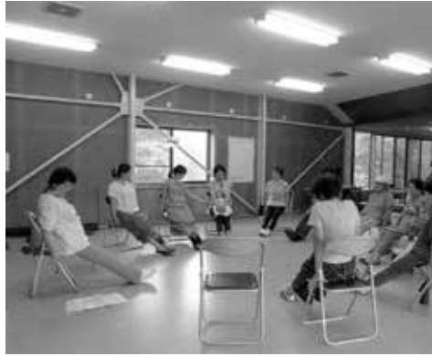
みんなで一緒に体操のーコマ

上山地区は美作市南部、雲海温泉の近く標高3000～5000mの位置にあります。 点在する家々の65歳以上の方を対象にサロン活動を行っている上山あじさいの会では、介護予防サポーターさんを中心に月に1度介護予防体操や、レクリエーション、ゲームなどを行っています。年に4～5回愛育、栄養委員の協力で昼食を用意してもらっています。 年に1回行っている三世代交流イベント、8月5日のそうめん流しの様子をご紹介します。