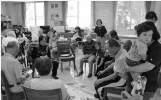
魚釣りゲームで盛り上がりました。

子育てサロン「ぱれっと」は毎月第2、第4金曜日午前10時から12時まで作東保健センターで開催されます。子供たちの遊びを見守りながら、ママさん同士おしゃべりをしたり親子で楽しい時間を過ごしています。是非、気軽にお越し下さい。