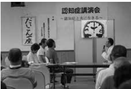
「ふれんどの会」さんの熱演

らしさが失われるわけではない。」というお二人の言葉は説得力があり、「認知症と共に生きる」というタイトル通り、地域で一緒に支え合つて暮らしていきたいと思いを新たにしました。