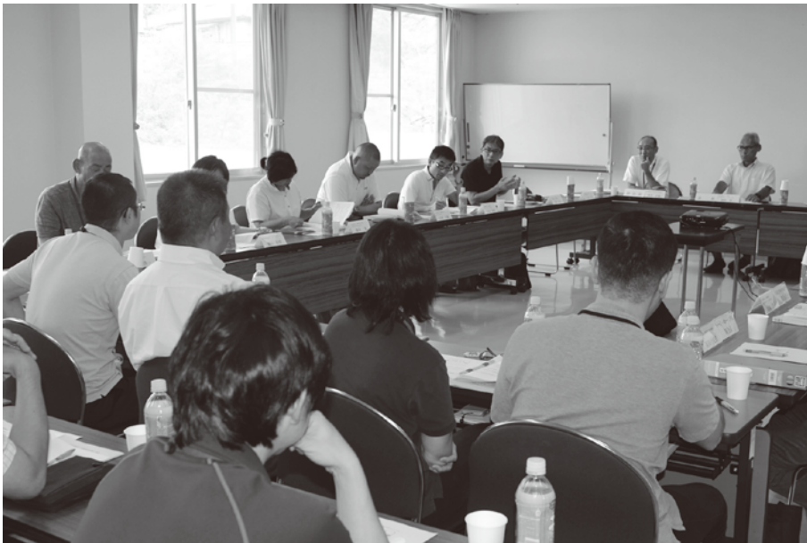
スムーズに支援を行うために協議

ゴミ屋敷の清掃作業部会からは、ゴミ屋敷状態にあった障害のある方の自宅の清掃作業について報告がありました。支援依頼が入った経緯から、支援方法等の検討、当日の作業までの流れについて報告があり、今後の支援方法等が協議されました。