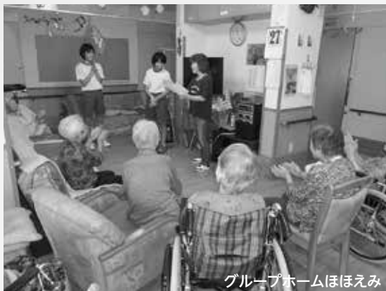
グループホームほほえみ