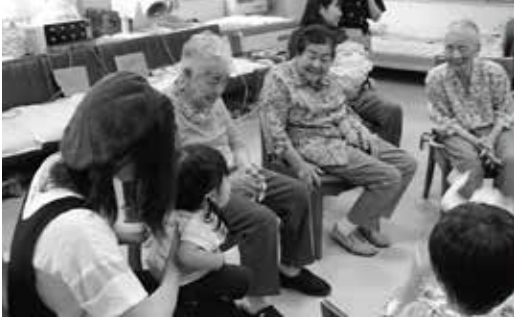
子供たちとの楽しいひと時

当日は約10名の親子が参加され、魚釣りゲームと一緒に楽しみました。子供たちは、おじいちゃん、おばあちゃんに抱っこされたり、利用者も子供たちの笑顔に目を細めていました。「可愛いなあ」「何歳?」「危ないでえ」と、いつも以上に声が出て、笑い声もあちらこちらから聞かれ、最後にプレゼントをもらい、楽しいひと時を過ごすことができました。