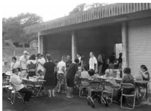
三世代交流事業として開催した納涼祭

西町地区は平成28年度からサロン活動を始めたばかりで、まだまだ手探りの活動状況です。当地区は高齢化が進み、住民の減少・人と人との交流も少なくなっているのが現状です。そんな現状を打破するため、サロン活動や老人クラブも復活させ、地区の活性化を目指しています。 サロン活動ですが、毎週火曜日と金曜日の2回移動販売に合わせ、12時から15時頃まで集会所を開放し、茶話会をしています。 高齢者の方だけでなく、若い方や男性女性を問わず色々な方に参加していただき、地区の