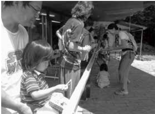
何が流れて来るのかな～！

上山地区は美作市南部、雲海温泉の近く標高3000～5000mの位置にあります。 点在する家々の65歳以上の方を対象にサロン活動を行っている上山あじさいの会では、介護予防サポーターさんを中心に月に1度介護予防体操や、レクリエーション、ゲームなどを行っています。年に4～5回愛育、栄養委員の協力で昼食を用意してもらっています。 年に1回行っている三世代交流イベント、8月5日のそうめん流しの様子をご紹介します。