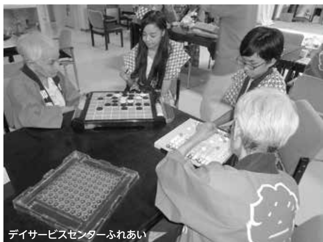
デイサービスセンターふれあい