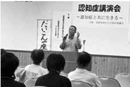
介護体験のお話をうかがいました。

介護の日々を思い出し言葉に詰まり、来場者も胸が熱くなる場面もありましたが、「認知症であつてもその人