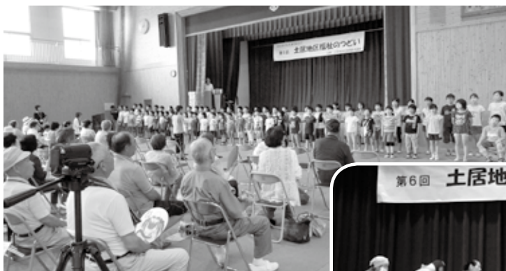
土居小学校全児童による合唱

6月27日（水）、土居小学校で「第6回土居地区福祉のつどい」が開催されました。会場内では土居小学校全校生徒による元気な歌声や、地元の方々多数の出し物が披露されました。