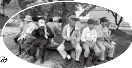
奉仕作業の合間一休み