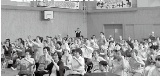
介護予防サポーターによる体操

た。今年は152名の方がゲームや体操に参加されるなど、笑い声の絶えない楽しいひと時を過ごされました。参加された方から、「遠くへは行けないので、毎年この集いを楽しみにしている」と話され、久しぶりに会う地域の方とも話しが弾み、盛会裏に終わることができました。