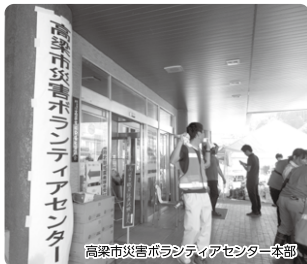
高梁市災害ボランティアセンター本部