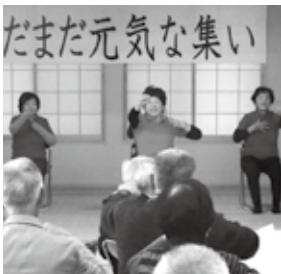
地域の行事で楽しく体操

皆さんが喜んでくださったり感謝してくださったり自分自身も元気になれます人にしてあげるのではなく、自分のためと思ってやっています。それで喜んでもらえたら言うことなし！