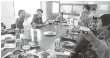
お花見会でかんばんーい!