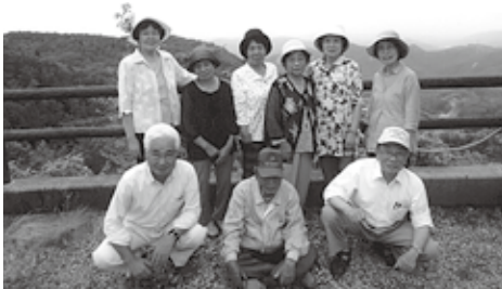
展望台で記念撮影