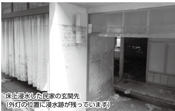
床上浸水した民家の玄関先 (外灯の位置に浸水跡が残っています)