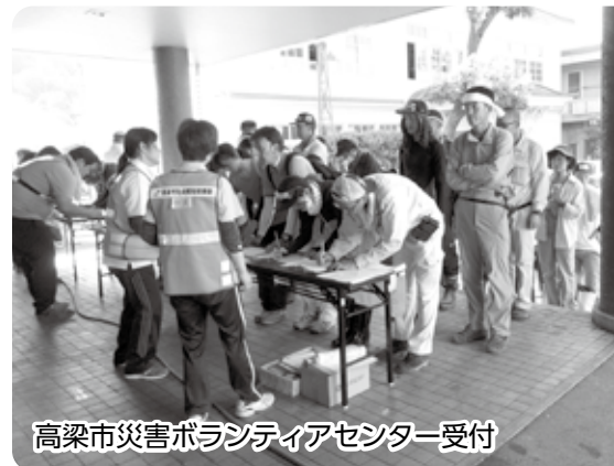
高梁市災害ボランティアセンター受付