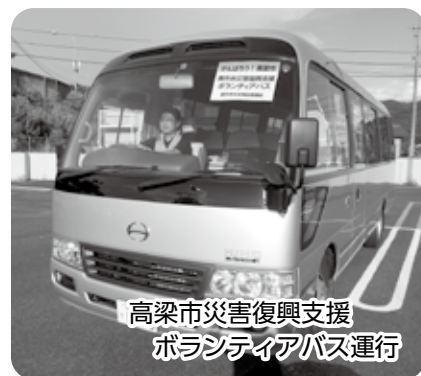
高梁市災害復興支援 ボランティアバス運行