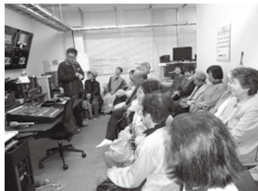
みまちゃんネルのスタジオ見学

さん花を咲かせておられます。今年には桜の咲く頃、美作市社協支援のバスツアーを利用してみまちゃんネルのスタジオ見学と西粟倉倉の里のバイキングを計画し、とても好評でした。また、毎回の食事は旬の物や畑でとれる物を主に使用して調理しています。今回は押し寿司に挑戦し、皆さんにとっても喜んでもらいました。そして「またサロンに来てんよー!」という呼びかけをしています。