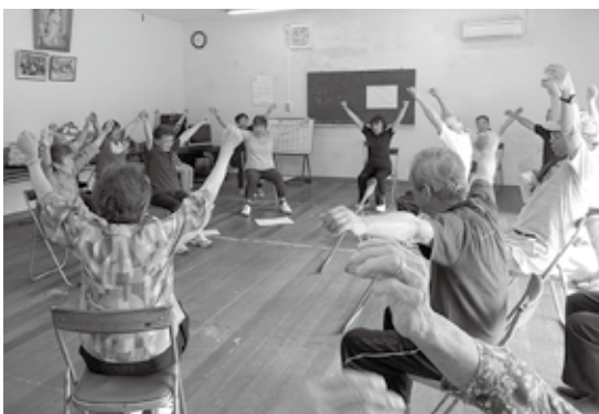
健康体操でリフレッシュ

詐欺予防の寸劇鑑賞、囲碁ボール、体操等を楽しみながら久しぶりに会う友人とおしゃべりに皆