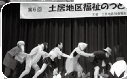
地区の方による寸劇（大きなかぶ）