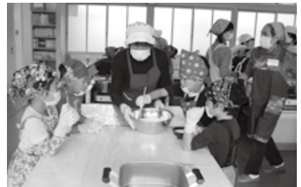
土居小学校の児童と芋まんじゅう作り

発活動などを行っています。また土居小学校の児童・土居幼稚園の園児と、文化伝承活動として芋さしから収穫した芋でのまんじゅう作り、よもぎ団子作りなど年間を通して小学校・幼稚園と協同で行っています。