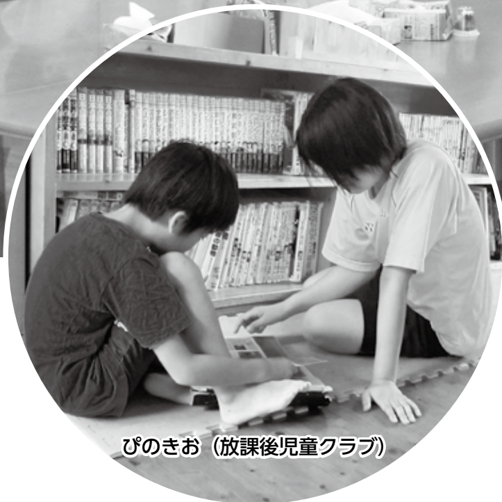
ぴのきお (放課後児童クラブ)

ボランティア体験を通じて、介護のお仕事の大変さと大切さを知ることができました。利用者さんや職員の方の笑顔が輝いていて、とても印象に残りました。