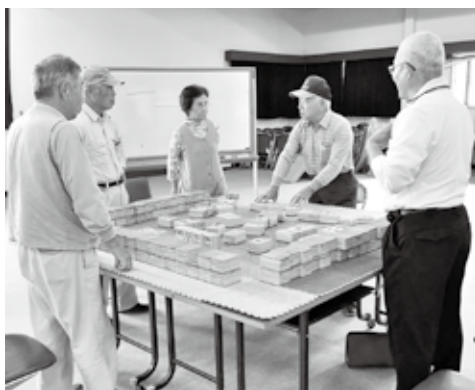
「認知症予防になるなあー」