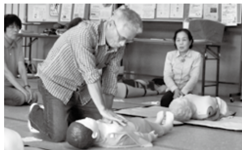
救急法を体験する参加者

9月14日（金）には「命をつなぐAED!～みんなで救おう!大切な命～」と題して、消防署職員の方による救急法の講習会を実施しました。活動中の緊急時に備えて、参加者のみなさんは熱心に受講されていました。ファミリー・サポート・センターの講習会・交流会には会員以外の方でも参加可能ですので、お気軽にぜひご参加ください。