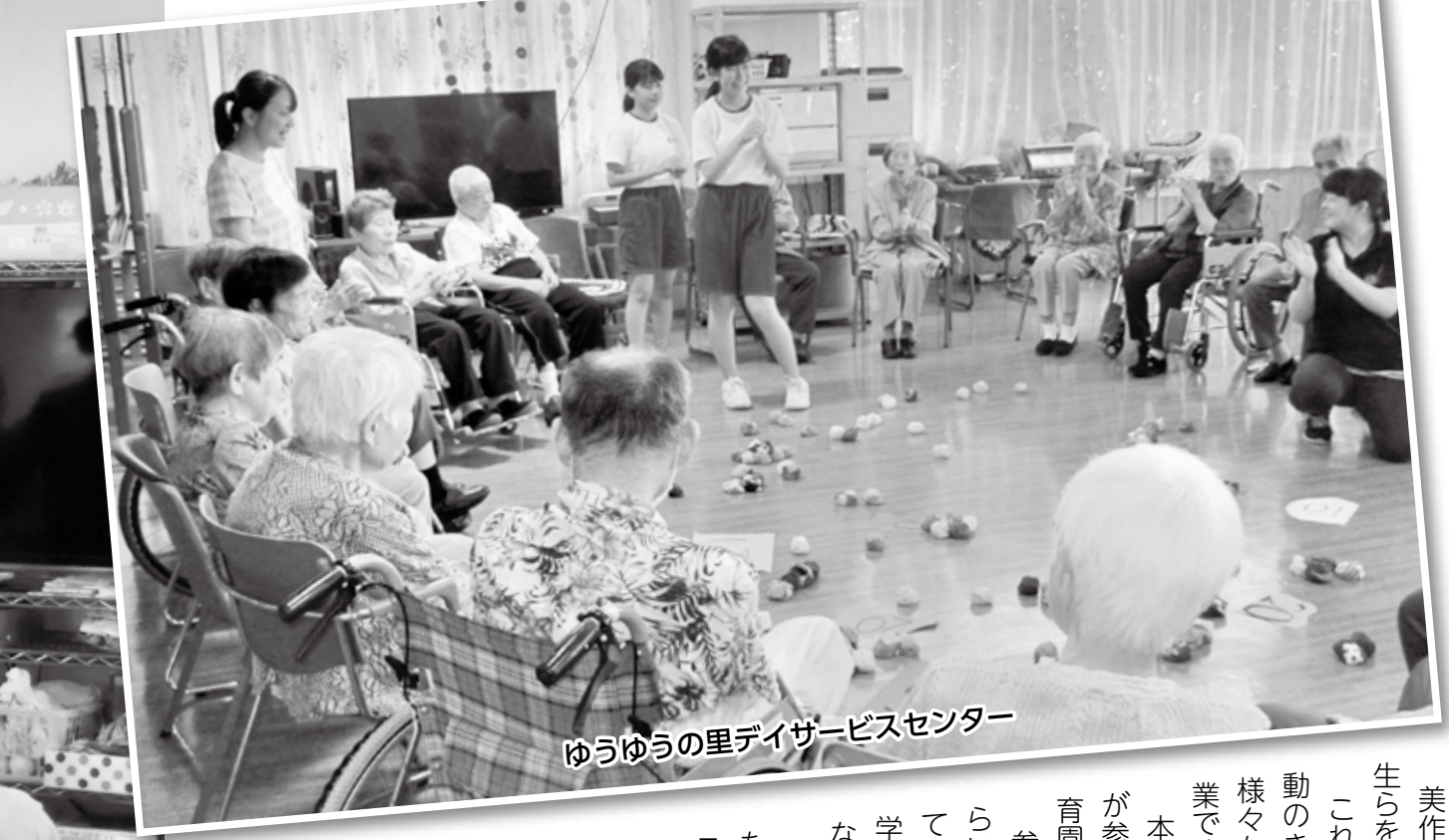
ゆうゆうの里デイサービスセンター