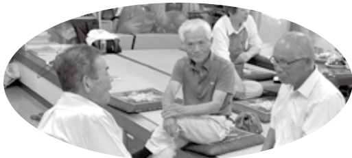
男同士で話しが盛り上がってます

東栗倉地域では、いきいきふれあいサロンが7か所開催されていますが、他の地区でも問題になっているように、『足が痛くてサロンにでかけることが困難になった』『サロンの段差がづらい』『サロンを運営する人材がなく開催できない』『参加者の高齢化で参加人数が減ってきている』など様々な問題を抱え、徐々にサロン参加者が減少してきています。 サロンを1か所だけでは人数が少ないので、2か所で開催してみたところ、いつもと違う参加者の顔ぶれも刺激的で盛り上がった地区があり、東栗倉地域全体で集まれる会ができないかと考えました。 東栗倉ボランティア連絡協議会や、認知症キャラバンメイトふれんどの会にも声をかけ、話し合いを重ね、子どもからお年寄りまで、誰もが集えるコミュニティカフェを開催することとなりました。