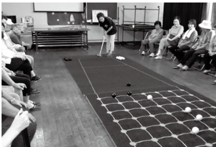
楽しく囲碁ボール

今回は男性の参加もあり、総勢20名の皆さんで大いに盛り上がりました。体を動かしたあとは、いつも協力していただいている愛育委員さんに今回は、カレーライスを作っていただきました。皆で一緒に食べるカレーライスはとても