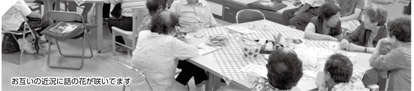
お互いの近況に話の花が咲いてます

今年度は5回開催、美作市営東栗倉バスを利用して東青野の美作市東栗倉ふれあいセンターまで、小旅行気分です。来ていただいて、午後のひと時をお菓子と飲み物で過ごしていただきます。初回の8月22日(水)は、夏休み期間ということもあ