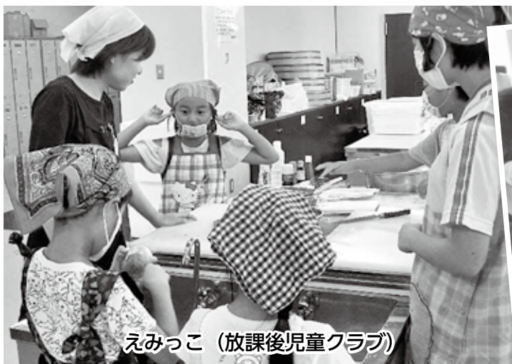
えみっこ (放課後児童クラブ)

障がいのある人と作業をすると聞いていたのでどのように関わればいいのか不安に思っていたけれど、優しい方ばかりだった。作業所の雰囲気が明るくて居心地がよく、皆で協力して完成まで頑張ることがとてもいいものだと感じました。