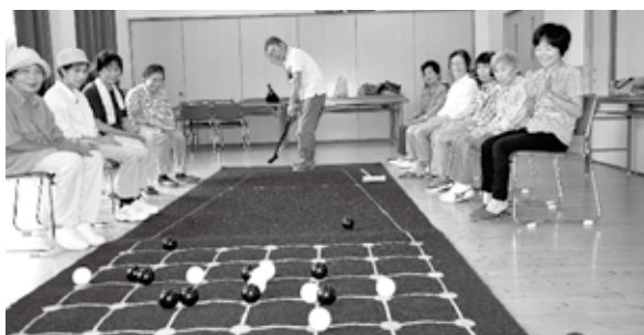
囲碁ボール（毎週・水）