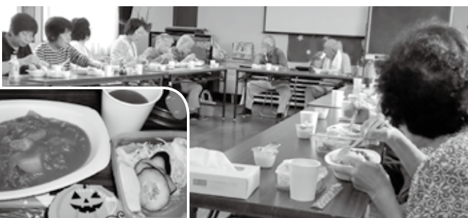
皆で食べると美味しい♪