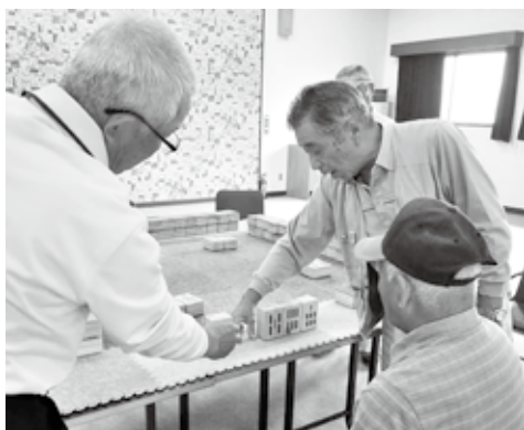
相談しながらゲームを進めます