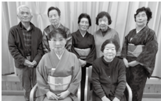
お茶の会で施設慰問

あまり堅苦しく考えず、自分にできることを、自分のペースで続けることだと思います。無理せず、ゆっくり活動して、いろいろな出会いを楽しむようにして