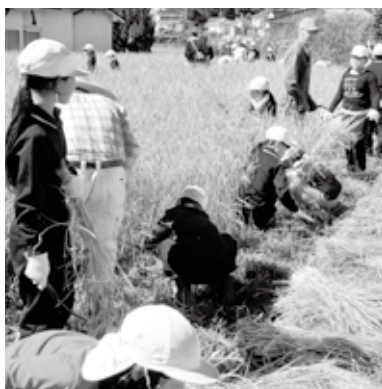
5年生は2年生の稲刈り指導役