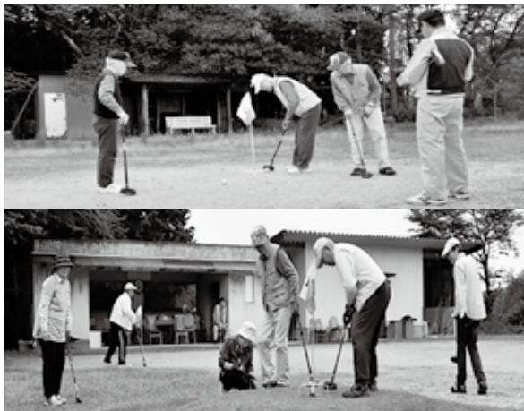
グラウンドゴルフ（毎週月・木）

毎回試合を行い年2回は賞品付きで表彰、平素の実力を競い合います。又一年間の平均打数を集計し優秀な選手には3位まで表彰し