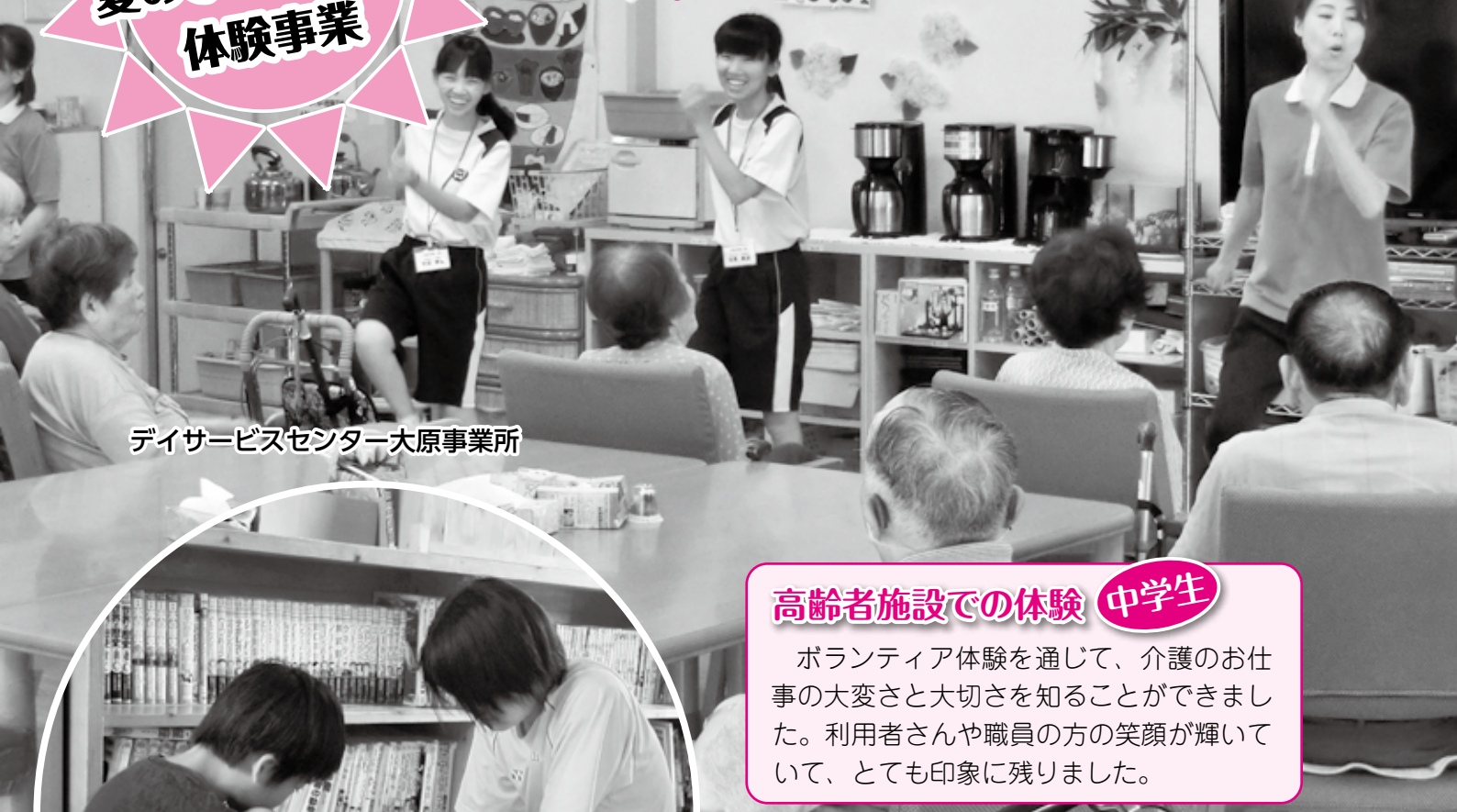
デイサービスセンター大原事業所