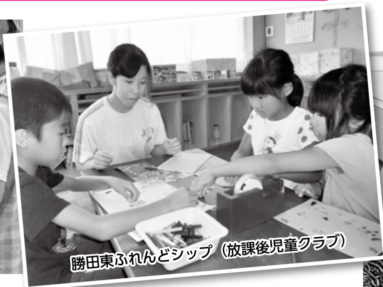
勝田東ふれんどシップ (放課後児童クラブ)