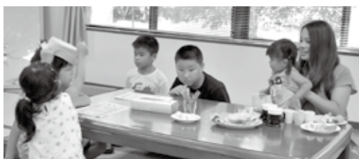
子どもたちも楽しそうです

り、地区の小学生や、放課後児童クラブの子供たち、乳幼児のお母さんたちにも声をかけ、子供にも楽しんでもらえるメニューを考えました。 一人暮らし高齢者の方にも参加を呼びかけたので、高齢者16名、小学生4名、乳幼児2名、一般参加者4名と様々な年代の方が集まっていたできました。 「久しぶりに出会えた」と話に花が咲きました。元気なお年寄りに圧倒されながら子どもたちにも自己紹介をしてもらい、交流の機会もできました。最後に、体操を行いました。最後の1時間30分でした。 ふれあい喫茶終了後、反省会を行いました。耳の聞こえが悪い方が