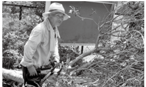
遺族会忠魂碑清掃

イメージにとらわれず、まず参加してみればどうでしょうか。顔を出すことが大事だと思います。そこでいろいろな人と出会い、いろいろな話をしていくうちに趣味の合う人と御縁があるかもしれません。いろんな人がいますので、自分と合わない人や、考えの違う人もあるかもしれませんが、いろいろ教えてもらったり、自分にプラスになる出会いもきっとあります。