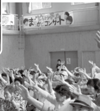
土居地区福祉のつどい

第7回 土居地区福祉のつどい 6月27日(木)、土居小学校で「第7回 土居地区福祉のつどい」が開催されました。土居小学校全校生徒による元気な歌声や、地元の方々の多数の出し物が披露されました。久しぶりに会う地域の方とも話しが弾み、大盛会で幕を閉じました。 (寄稿: 作東支所 川元かおり)