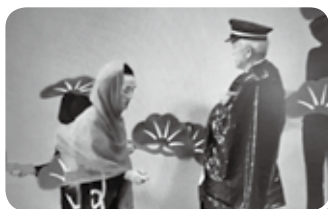
▲この一席による「金色夜叉」

第6回 粟井村ふれあいの集い 6月9日(日)、旧粟井小学校で「第6回 粟井村ふれあいの集い」が開催されました。 地域の方々の出し物や、展示が披露されました。また、管楽アンサンブルコンブリオ、すみれ親子合唱団等、素敵な演奏や歌声で、会場が大いに盛り上がりました。 (寄稿: 作東支所 白岩 瑠美)