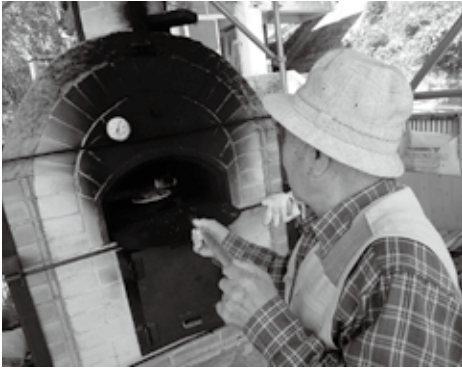
老若男女みんなで焼きました。