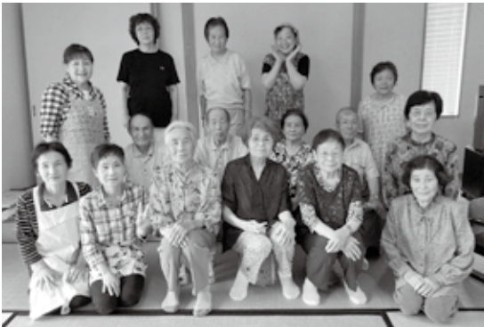
皆で元気にサロンに参加

盛り上がり、特にご年配の方からの「計画してくれて有り難う」の声に感動をしました。