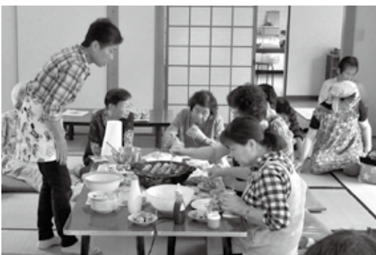
たこ焼き上手に焼けました