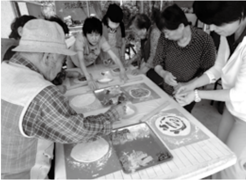
「どの具材をのせようかな。」

広いなあ。まだ行ったことがない所がたくさんあるなあ。」と自作のピザを食べながらのんびりおしゃべりを楽しみました。