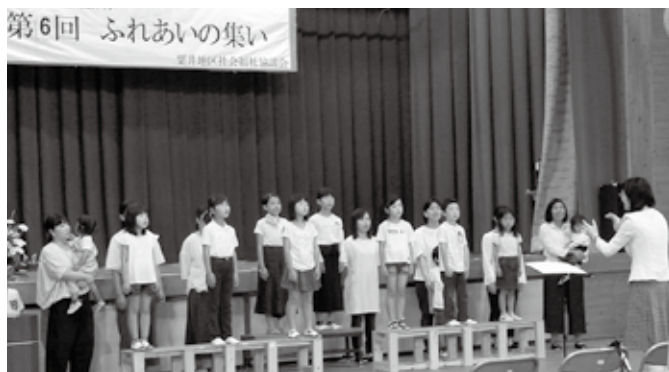
粟井村ふれあいの集い

第6回 粟井村ふれあいの集い 6月9日(日)、旧粟井小学校で「第6回 粟井村ふれあいの集い」が開催されました。 地域の方々の出し物や、展示が披露されました。また、管楽アンサンブルコンブリオ、すみれ親子合唱団等、素敵な演奏や歌声で、会場が大いに盛り上がりました。 (寄稿: 作東支所 白岩 瑠美)