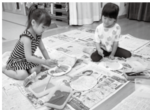
うちわにお絵描き中

7月18日(木)、美作市世代交流多目的ホールで子育てサロン(こっこ)「すくすくの日」が開催され、親子でうちわ作りを楽しみました。参加した約40名の親子は、それぞれうちわに手形を押ししたり絵を描いたり、ワイワイと楽しい時間を過ごしながら、世界に一つだけの特別なうちわが出来上がりました。子育てサロン(こっこ)は毎週月・木曜日10時〜12時に北山の世代交流多目的ホールにて開催しています。また毎月第2木曜日は、子供やおもちゃなどのリサイクル、