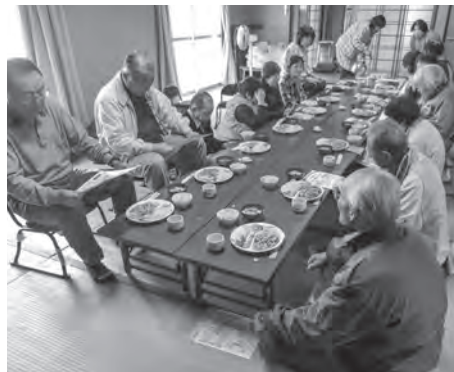
みんなで食べるとおいしいね

越しいただき「ツキノワグマ被害防止対策出前講座」を受講しました。クマ鈴作りにも挑戦しましたが、みなさん四苦八苦しながらも先生のご指導の下、なんとか作成することができました。川戸の近辺でも毎年クマの目撃情報があり、他人事ではなく、みなさん真剣に話を聞かれました。