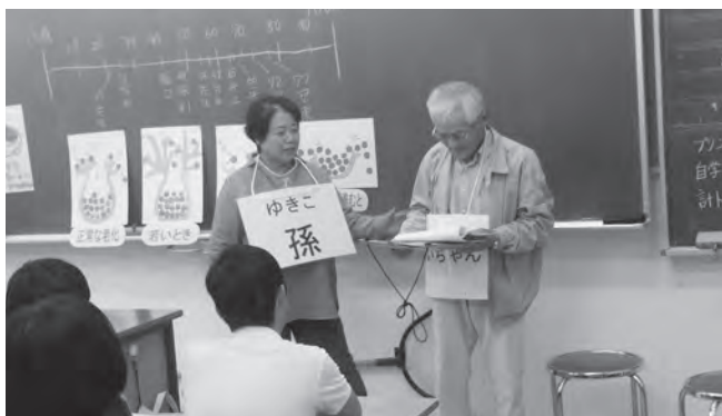
認知症の役を好演する会員

当日は、先生や「ふれんどの会」の会員が感じている、加齢による体の変化や考え方について話を伺った後に、認知症について会員からわかりやすく認知症の症状等について学びました。そのあと認知症サポーターが認知症役・聞き手役となり、日常での場面を寸劇で表現し認知症の方へのかかわり方がいかに大切かを学んでいました。 (寄稿：東栗倉支所 保利圭一朗)