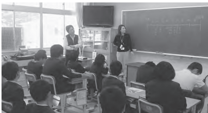
認知症のことを真剣に聞く子供たち

10月30日(水) 東栗倉小学校、5・6年生を対象にした認知症についての福祉教育を行いました。昨年から校長先生より、児童に認知症について学ぶ機会を持つてもらいたいという希望があり、東栗倉地域で認知症の啓発活動をしている「ふれんどの会」と美作市社協との協働により認知症の福祉教育を行うことになりました。