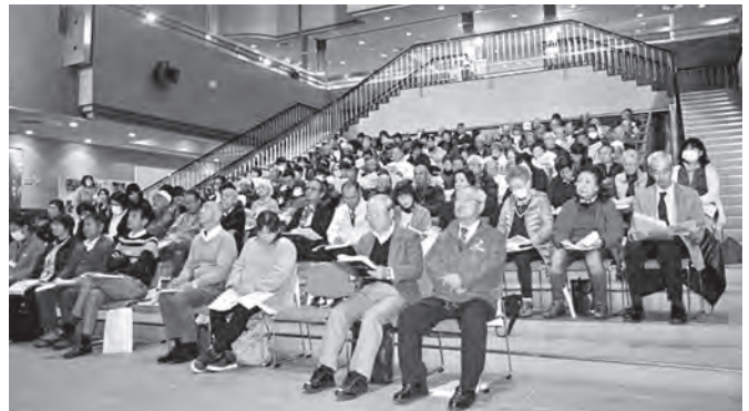
熱心に聴き入る参加者の皆さん

障害のある人が地域の一員として社会に溶け込み生活できる地域共生社会を実現するためには、地域住民や地域の多様な主体の連携が必要であり、一人一人が障害や障害のある人に対する理解と関心を広く深めることが重要です。