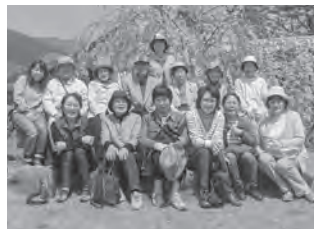
サロンの皆さんと記念撮影