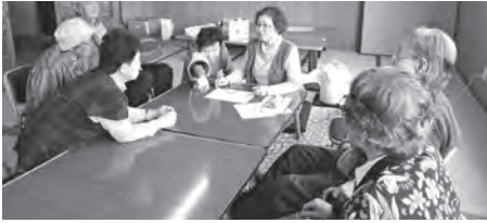
「元気だった?」「薬ちゃんと飲んでる?」と声かけをしながらの血圧測定