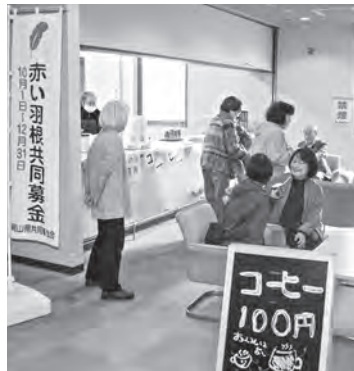
コーヒーコーナー