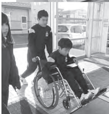
緊張しながらの車いす体験

し、障害者や高齢者の立場になって、年を重ねるとはどういうことか、障害を抱えるとはどういうことかを実体験を通して学ぶことができたと思います。