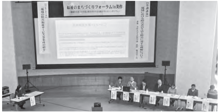
リレートークの様子（各事業所の紹介や説明）