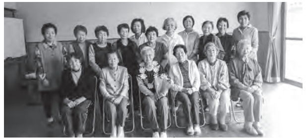
百寿のお祝い会を開催