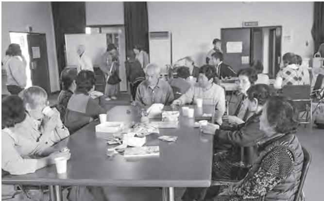
ワンコインカフェふらっと

「今までお世話になった地域の方に恩返しをしたい」との思いから、地域包括支援センターの後押しもあり、「健康で楽しく毎日を暮らす」という目標に、高齢者ふれあい・いきいきサロン「真加部なかよし会」を発足しました。また、ボランティア活動を通じて仲間もでき、様々なボランティア活動に参加するようになりました。