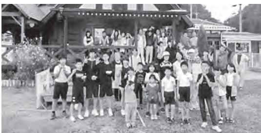
全員揃って記念写真

き」や「おでん」作りに奮闘。子供たちの行列が出来て作り手が悲鳴を上げるほどの盛況でした。日頃参加の少ない現役世代の皆さんは社協の活動は知っていたが実際に参加したのは初めてで、高齢者の皆さんと子供たちが共に大きな声で話し笑っているのを見ると嬉しくなりました。