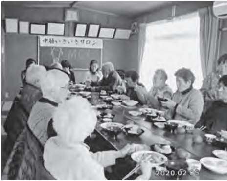
出前講座の後皆で食事中

中筋は湯郷の北西部に位置し、小さな集落が6ヶ所で中筋と呼ばれています。それぞれの集落に1人ずつ役員を置いてサロンが成り立っています。年度末に役員で集合して「来年は何をしようか…どんなことがええかなあ…」と話していますが、結局のところ、1人でも多く集まってもらって楽しんでもらうには集会所でゆっくりおしゃべりをして食事をするのが一番です。今年も4月の花見にはじまり、6月の年1回のバスツアーで自衛隊視察、8月の囲碁ボール大会（頑張った後のソーメンの美味しかったこと）、そして10月