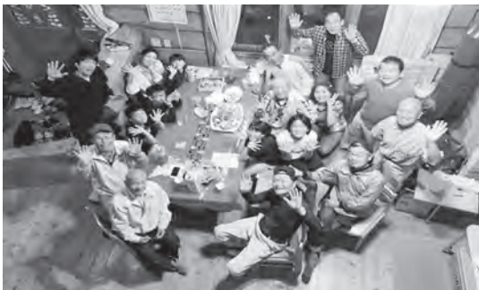
ログハウスの中でお喋り会