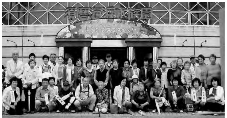
吉野福祉ボランティアの会「ふれあい見学」

参加してくださった高齢者の皆様がニコニコと笑顔で話し合われている様子を拝見すると、この活動をし