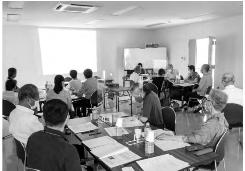
地域福祉講座グループワークの実習

「地区社協メニュー事業の見直しについて」、「地域福祉講座グループワークの実習について」協議が行われました。