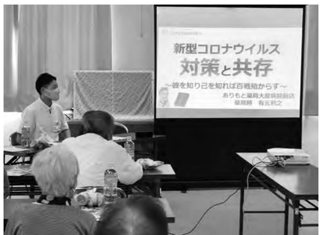
薬剤師会による講話