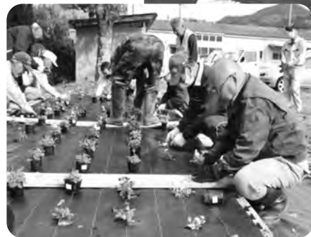
花壇作りをする役員