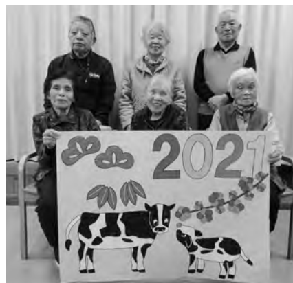
コスモス苑利用者の皆さん