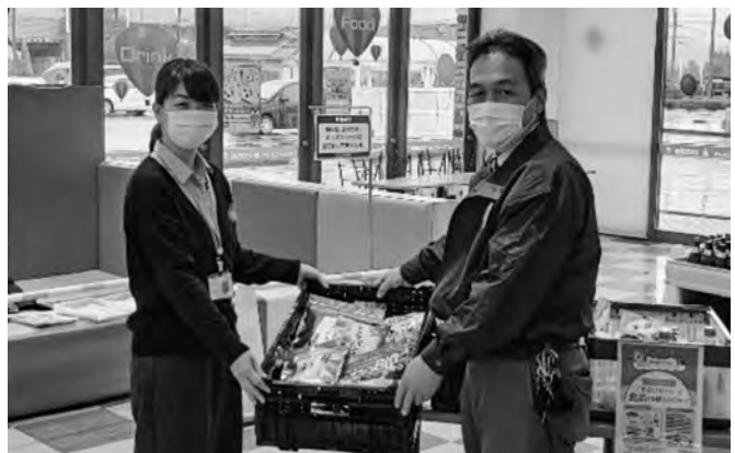
上浦店長(右)から寄附品を受け取る社協職員

ご寄附いただきました食料品(74点、27.4kg)は、美作市社会福祉協議会を通じて生活にお困りの方への支援に活用させていただきます。