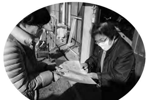
お変わりないですか～ （脳トレ・体操資料の配布）