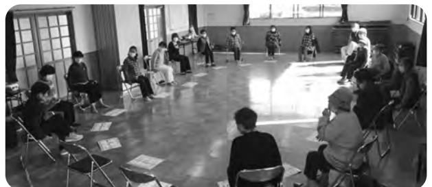
ミニサロン（換気・消毒など徹底して活動中！）