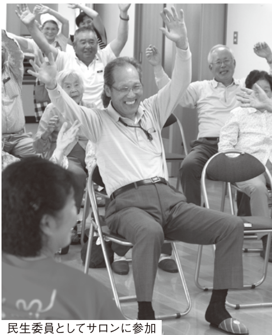
民生委員としてサロンに参加