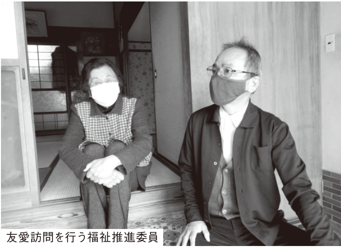
友愛訪問を行う福祉推進委員

新型コロナウイルス感染症の広がりによって、地域住民等による地域福祉活動やボランティア活動は休止や延期等による活動自粛が増加しています。そのため、閉じこもりによる高齢者の虚弱化の進行、社会的孤立の深刻さ等が浮き彫りになっています。