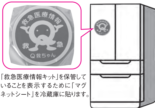
「救急医療情報キット」を保管していることを表示するために「マグネットシート」を冷蔵庫に貼ります。

持病やかかりつけ医等の医療情報、緊急連絡先等を記入した「緊急連絡カード」を入れた筒状の容器のことです。駆け付けた救急隊員がすぐに探し出すことができるよう冷蔵庫に保管することを推進しています。(冷蔵庫はほとんどのお宅の台所にあり、かつ災害にも強いと思われるためです。)