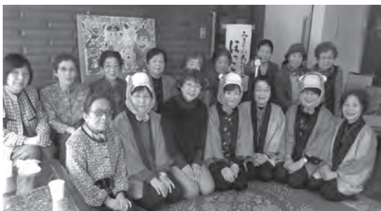
サロンで参加者の皆さんと記念撮影 大盛況でした！