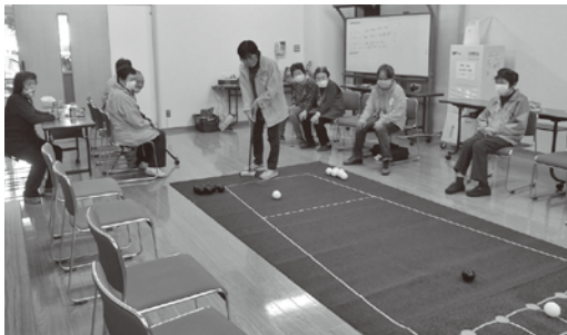
よんないカフェで利用者と一緒に囲碁ボール