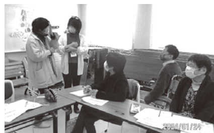
ミニ寸劇のシナリオを 実演を通じて検討しました。