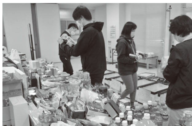
賞味期限ごとに仕分けする社協職員

この度、令和5年1月10日(火)から1月20日(金)にかけて美作お助け隊(美作市内の社会福祉法人等連絡協議会)フード&ライフドライブを実施しましたところ、多くの方々のご協力により、たくさんの食料品や日用品の寄附をいただくことができました。皆様のご厚意に深く感謝致します。