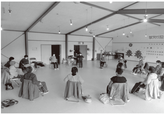
大野コミュニティでの介護予防体操教室の様子