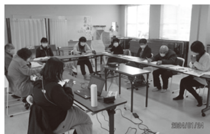
クイズの内容について意見交換