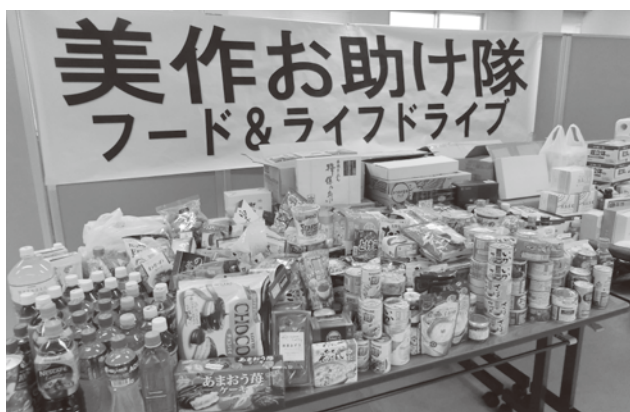
ご寄附いただいた食料品や日用品

フード&ライフドライブとは、いただきものや買いすぎてしまった食料品など、家庭や企業で余った食料品・日用品を募り、必要としている人に提供する活動です。