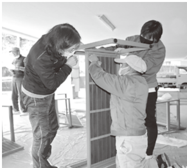
ベンチの組み立て中

これからも「招(商)福連携による移動販売モデル事業」を通じて、障害や生きづらさを抱える方も地域の中で共に暮らし、交流し活躍の場を広げていけるよう、活動を続けて参ります。