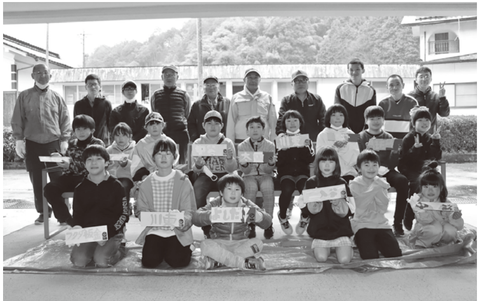
皆でベンチを作成しました

この事業は中央共同募金会の「赤い羽根福祉基金」の助成を受け活動しています。 今後とも皆様のご協力をよろしくお願いいたします。