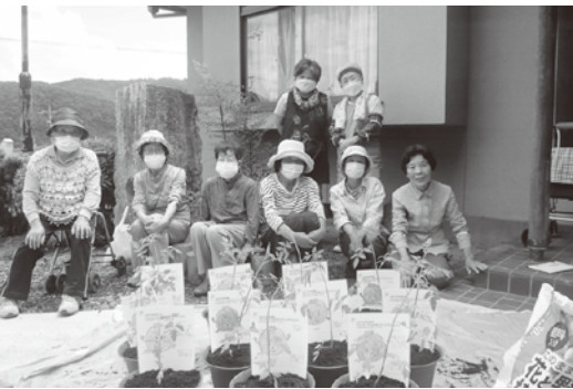
スマイルプロジェクトにも参加しました

平成22年に開催された介護予防サポーター養成講座を受講し、介護予防サポーターのグループである「すみれ会」に参加しました。 また地域での親睦の場として同年の10月8日に「林尾楽友会（りんのらくゆうかい）」を立ち上げました。