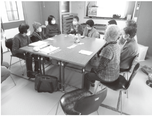
サロンでおしゃべり