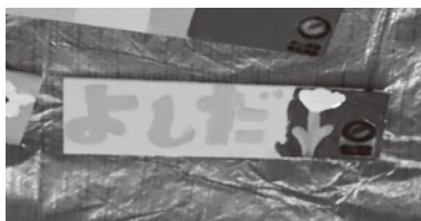
立ち寄り場所を示す地区名のプレート