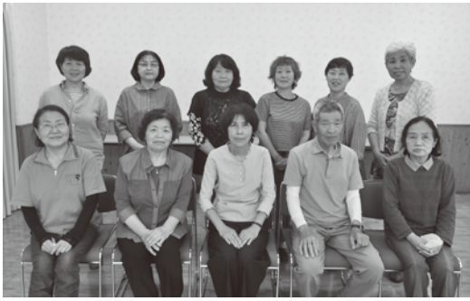
サポートこっこの皆さん