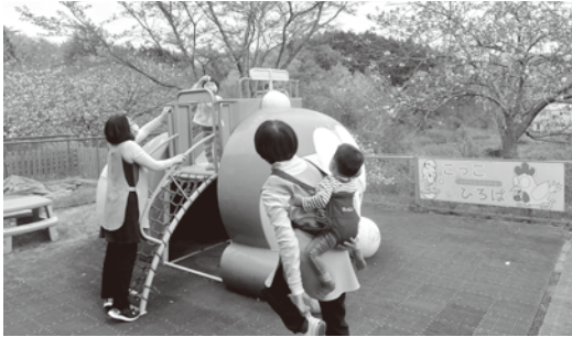
天気の良い時は屋外で