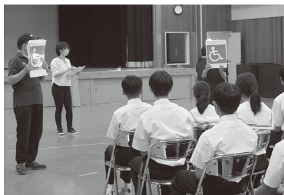
福祉マークの説明