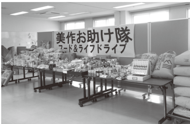
たくさんのご寄附をありがとうございました。