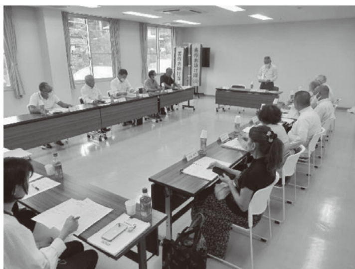
9月26日開催の評議員会の様子

当日は、第1期福祉のまちづくり行動計画(H30～R4)の評価表の報告も行われました。第1期計画期間中には、地域包括支援センター、障害者地域活動支援センター、総合相談支援センター等、様々な新規事業を受託し、住民の生活課題への対応が可能な組織体制を整備してきたことなど、30項目の計画について内部評価を行い、5年間の実績と成果について報告を行いました。