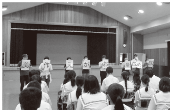
初めまして!美作えがお◎広め隊です!