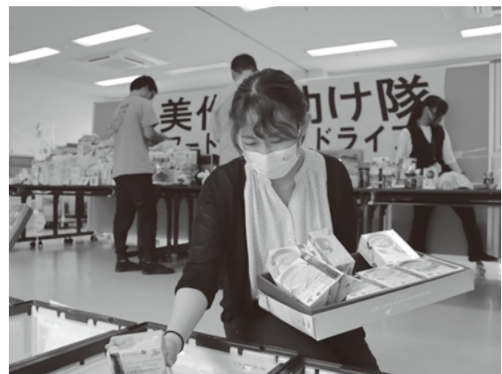
仕分け作業を行う職員