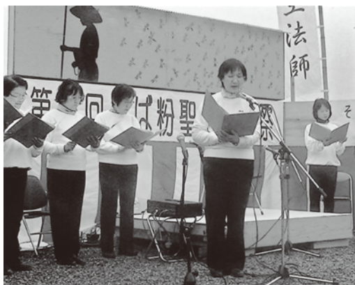
練習を重ねた朗読を披露

子どもたちから元気をもらいながら、楽しい絵本の読み聞かせができます。前向きな気持ちになれるので、声を出すのが苦手な人もみんなと一緒に練習しましょう。毎月第4金曜日の13時30分から湯郷地域交流センターで例会会をしています。定例会では朗読と読み聞かせの練習もしていますので、ぜひお気軽に見学にお越しください。美作市社協美作地域ステーション（電話 7213677）までお問い合わせください。