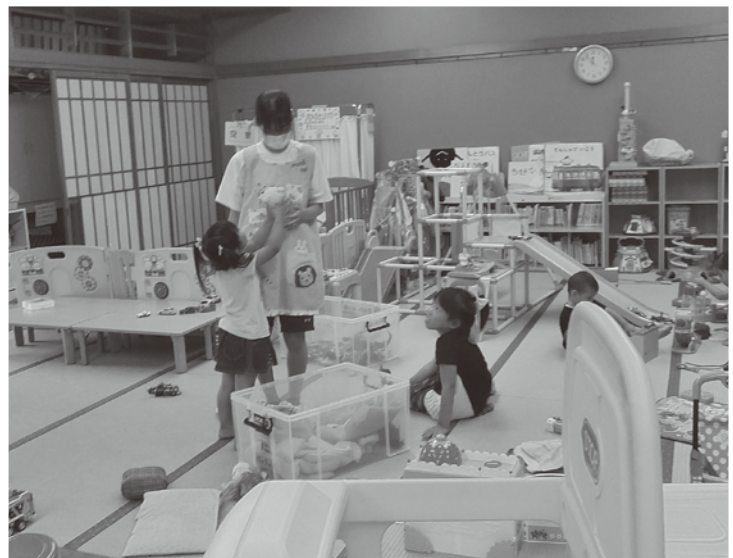
子育てサロン「こっこ」

年の離れた子どもたちと上手にコミュニケーションがとれるか不安だったが、言い回しを意識することで、話を聞いてもらえることができました。