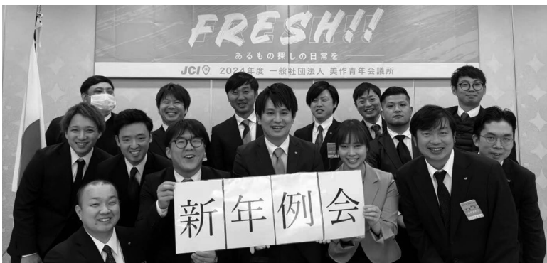
美作青年会議所会員の皆さん