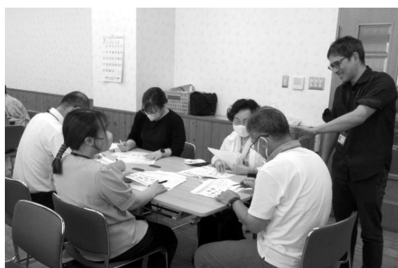
和やかな雰囲気グループワークが行われました