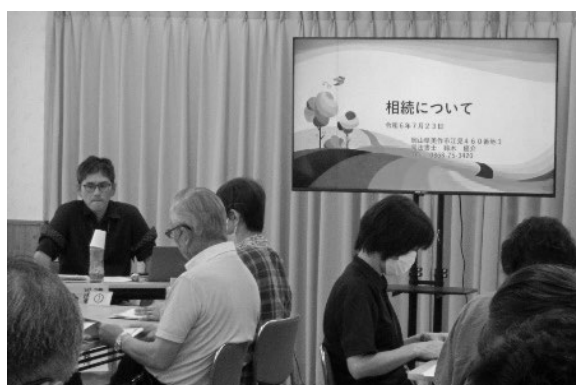
熱心に講演を聞く参加者の皆さん

参加者からは「相続について初めて知る制度もあり、先生の話もわかりやすく、とても勉強になった。」「市民後見人同士の情報交換もできて、良い機会となった。」との声があり、市民後見人の学びを深める有意義な研修会となりました。