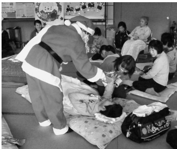
クリスマス会でプレゼントを受け取る参加者

美作心身障害児・者の親の会 クリスマス会開催 私たちは、心身に障がいがある子供を育てている親の会です。2ヶ月に1度会合を開き、情報交換や福祉制度の勉強をしたり、施設見学に行ったりしています。 また、子供たちのお楽しみ会として夏は七夕会、冬はクリスマス会を開いています。今回のクリスマス会は、11月27日(日)、北山の世代交流多目的ホールで行われ、子供たち、会員家族、ボランティアの方々30数名が集まり、クリスマス会の歌を合唱・合奏したり、ツリーを飾りつけたりし、サンタコース登場の際には、みんな大喜びでした。多くの方々のご協力をいたたきながら、楽しく有意義な1日を過ごすことができました。