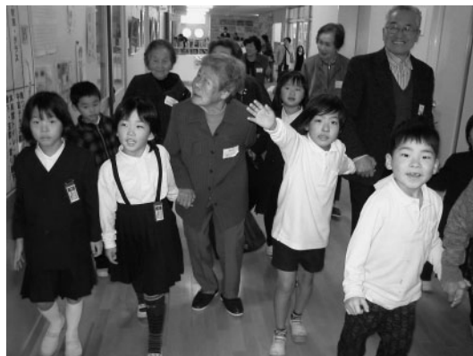
手をつないで校舎を案内する子供たち