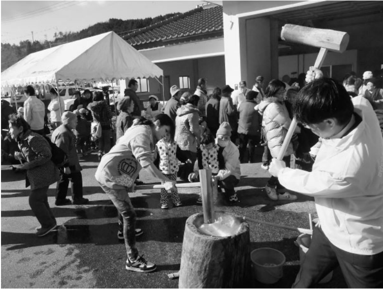
参加者による餅つきの様子

この大会は、梶並地区(右手・真殿・梶並・楮・東谷上・東谷下)で字ごとに組織されていた地区社会福祉協議会を梶並地区社会福祉協議会として一体化し、その記念イベントとして梶並地区住民や梶並小学校児童、子育てサロンの親子等総勢約200人が集まり、盛大に梶並地区社協誕生を祝いました。