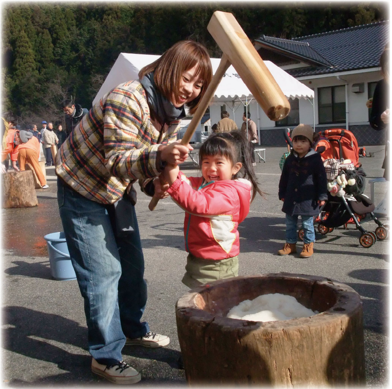
梶並地区社協設立記念 ふれあい餅つき大会 (勝田地域 やまゆり苑広場)

社協だよりは、皆様からお寄せ頂いた社協会費・寄附金の一部を使って発行しています。