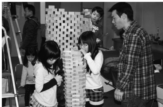
つみきを高くつんでいく子どもたち