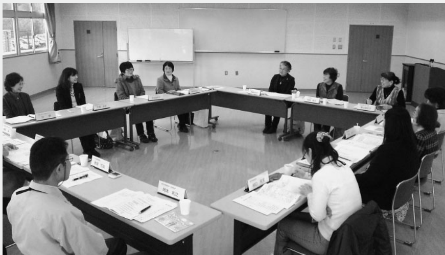
子育て支援について協議する参加者

市内の子育て支援者がお互いの活動を報告し合うのは初めてで、ボランティアアングループからは、参観日での託児や読み聞かせなどの報告があり、また、子育て相談員からは地域での活動状況や幼稚園・小学校での訪問交流、児童虐待問題などの報告がありました。参加者からは、「地域によって子育て支援環境が異なっている」「子供を地域で見守る環境をどうつくるかが課題」などの意見が出され、地域で見守る子育て支援をどう進めていくか、今後も情報交換会を継続していくこととなりました。