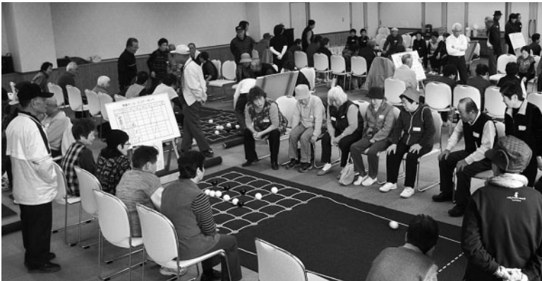
総勢約100名が参加し、熱戦が繰り広げられました。

最後に、柏原町の皆さんには、お土産の「後山大根」が手渡され、囲碁ボールを通じた和やかな交流会となりました。