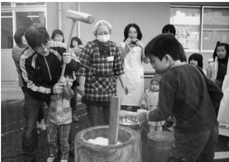
みんなで息がピッタリ合った餅つき