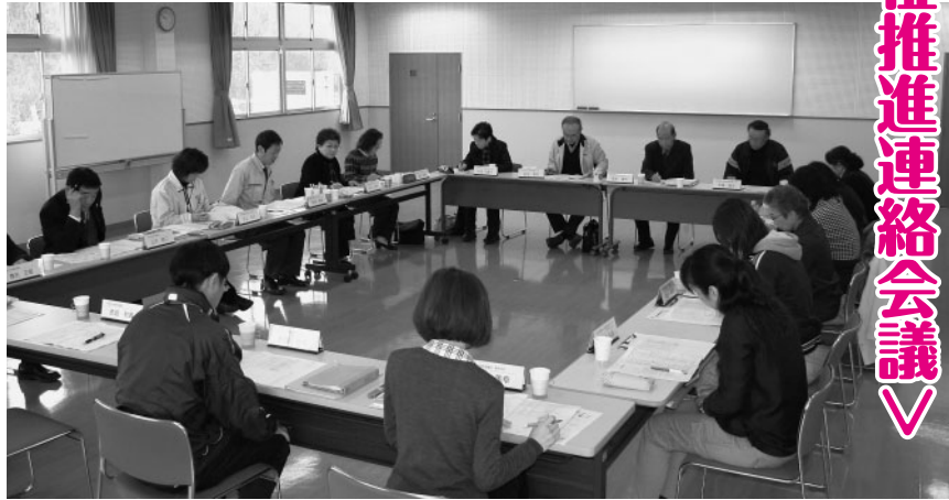
福祉団体の連携を話し合う参加者

この連絡会議は、市内の他地域でも開催される予定になっており、さらに細かい地域単位でも連携の在り方を話し合つていくな予定としています。