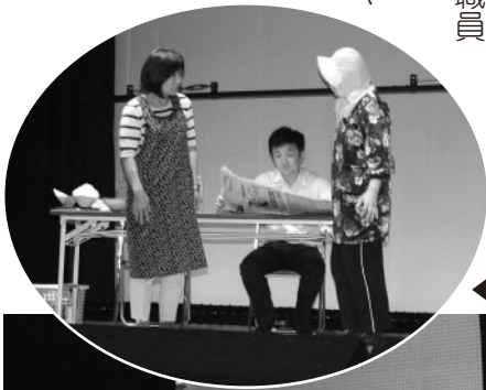
◀寸劇「花子さん家の最近のできごと」