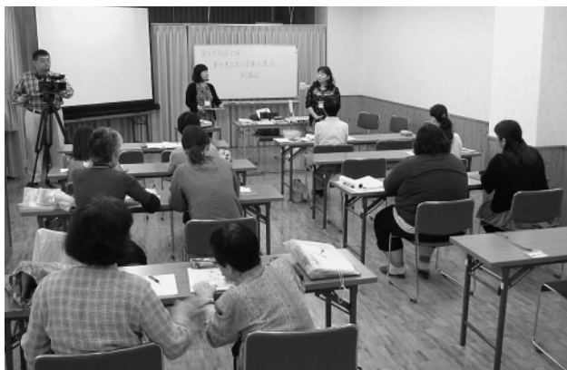
要約筆記講座で自己紹介をする受講者

この講座は、厚生労働省要約筆記奉仕員カリキュラムに沿った講座(全52時間)で、講座修了者は要約筆記奉仕員として活動することができます。