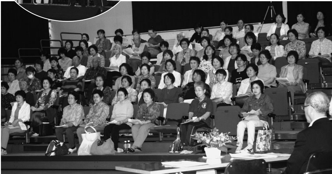
美作市ボランティア連絡協議会総会の様子