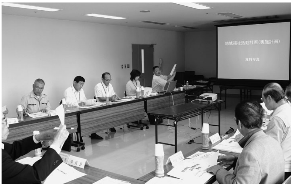
評価委員会で活動計画の進行状況を説明する社協事務局

また、「地域社協連絡会」や「地域福祉推進連絡会議」を背景に、地区社協活動の支援策として、平成23年度策定した福祉ネットワークづくり事業については、一定の評価をいただくことができました。