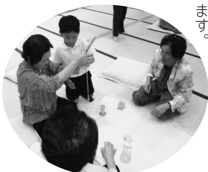
魚釣りゲームを教わる

今後も、地域の高齢者の皆さんと児童・園児とのふれあいなど、地域に根ざした交流会を開催していきたいと思えます。