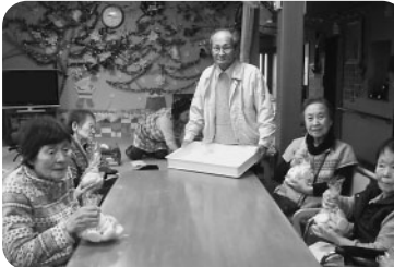
おいしそうなおもちに喜ぶ「デイサービスセンターふくだ」の皆さん