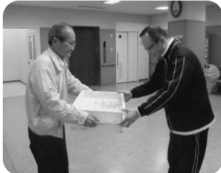
「総合ケアサービスセンターかつた」においておいしいおもちを届けました