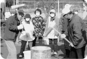
もちつき大会の様子