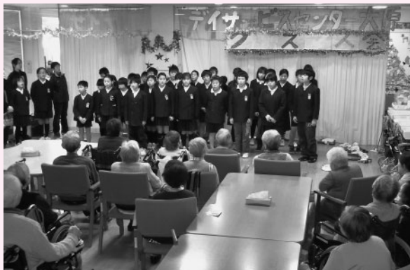
クリスマス会で合唱を披露する児童

デイサービスセンター大原では、年間を通じて季節に応じたイベントを開催しており、4月にはお花見を予定しています。