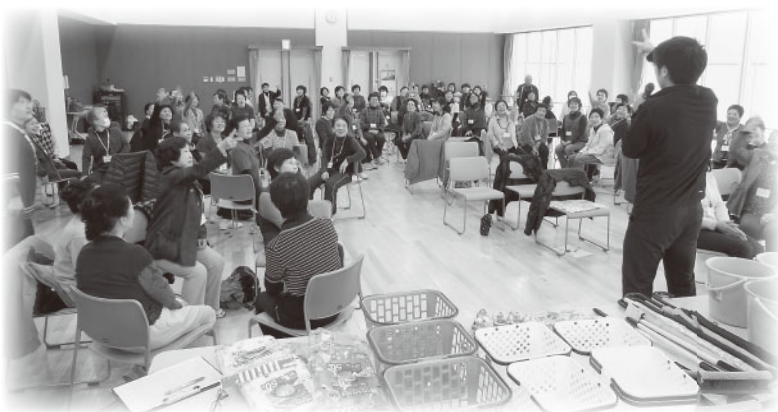
「すきやきじゃんけんゲーム」を学ぶボランティア

この交流会はボランティアグループ同士の連携を目的に毎年開催しており、参加した会員からは、「毎年参加し、顔見知りの人が増えてきた。ボランティア活動をしていると、仲間づくりもできるし、参加することで自分自身も元気になれる」との声が聞かれました。交流会で新しいレクリエーションを学び、地域でのボランティア活動につなげていただきたいと思います。