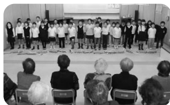
「ふるさと」を一緒に唄いました