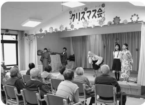
4年生の音楽劇「鶴の恩返し」

東栗倉デイサービスセンター事業所は、小学校と隣接しており、学校行事や授業の中で、児童と高齢者の方々が交流したり、ふれあう機会を持つような、地域に密着した施設運営にも取り組んでいます。