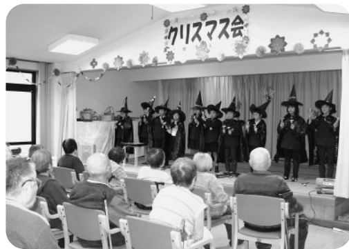
3年生のハンドベル演奏