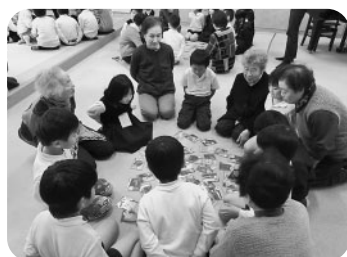
一斉にドーン「カルタ」取り

「ふるさと」を一緒に唄いました。また交流したい」と散会されました。 昼食を食べながら、子供たちとおしゃべりを楽しみました。孫やひ孫のような1年生を前に終始笑顔があふれ、和やかな雰囲気の中、「元気な子供たちと交流できてよかった。また交流したい」と散会されました。