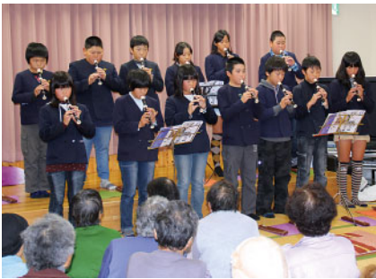
土居小児童によるリコーダー演奏

12月8日(日)、福山地区自治振興協議会(福祉部)主催によるミニデイサービスがさくとう山の学校で開催され、役員の方々の熱心な声かけにより約70名の参加がありました。この集いは75歳以上を対象に毎年開催しており、今回は「まだまだ元気な集い」と題して、地元で活躍する若者がふるさとへの思いを込めて作詞・作曲をした歌の披露や大正琴の演奏、土居小児童による合唱、フルートの生演奏で演歌を参加者全員で歌うなど、地元演者による心温まる集いとなりました。参加された皆さんの会話が花が咲き、大盛会のうちに幕を閉じました。