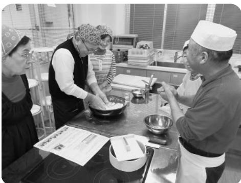
こねる作業は力が必要で、ここは男性の出番です

体験実習では5班に分かれて、それぞれの工程で講師にアドバイスをもらいながら実習をしました。最後の工程を終え、ゆで上がったそばは太いもの細いものがあり、どれも個性豊かでしたが、実食の際には、口々に「うまい!!」の声が上がり、それぞれの班の麺を見くらべ食べくらべをして、手作りの味を堪能されました。