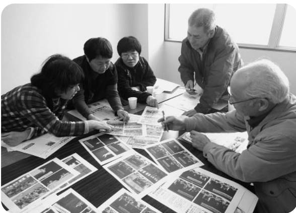
地区社協だよりの編集委員会の様子