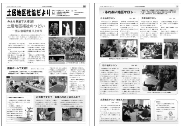
完成した「土居地区社協だより」第7号