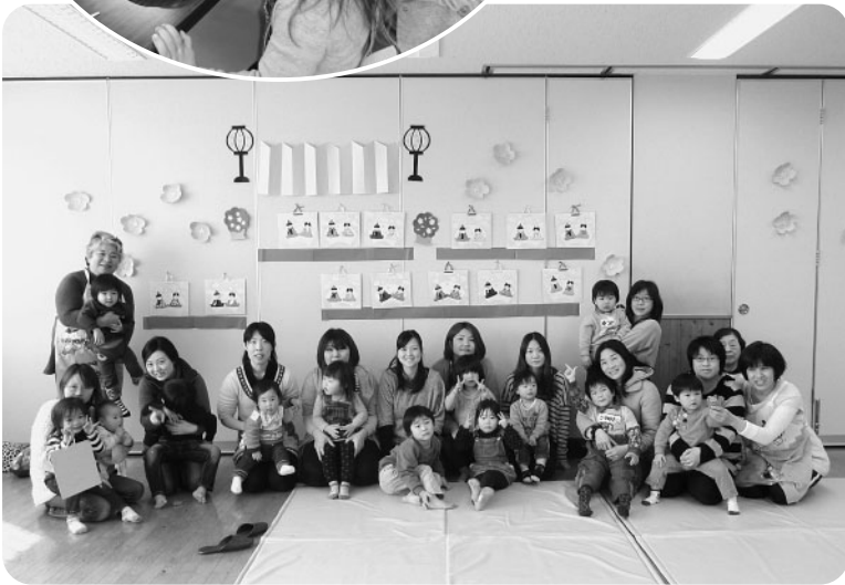
壁に飾ったおひな様の前で記念写真