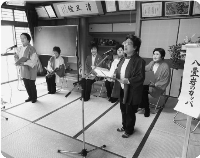
みまさか朗読の会の語り