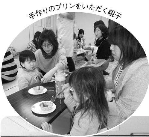
手作りのプリンをいただく親子

この後、サロン活動に携わっている栄養委員会メンバーによる「イチゴプリン」をいただき、親子でふれあいを深める良い機会となりました。