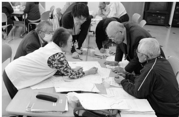
勝田東地区社協の見守り会議