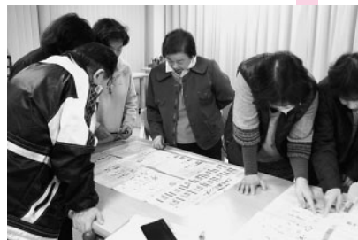
ゴミ出しカレンダーを囲んで、意見を出し合う