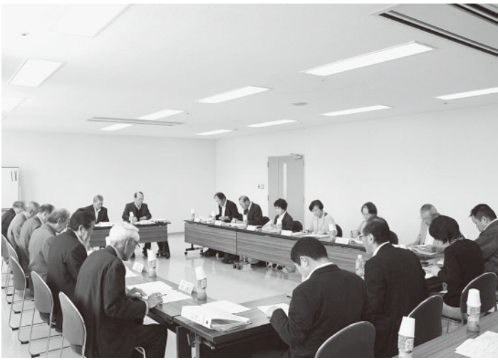
平成26年度事業を審議する連絡会役員

同連絡会は、市内地区社協活動の更なる発展のため、地区社協の代表者が集い、相互の情報交換や、地区社協運営に関する研修及び調査等を行う場として、下記事業計画により事業を行い、「地域住民の参加と支え合いによる福祉のまちづくり」を目指