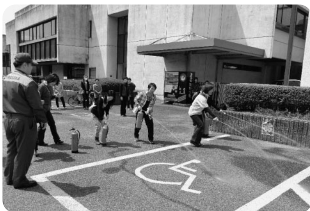
消火器を使った初期消火の実習をしました

日赤大原分区協賛員会では、年2回の研修会を通じて会員の救急法等の普及を図っております。また、大原地域においての日赤社費募集と赤い羽根共同募金にかかる募金活動へのご協力をいただいております。