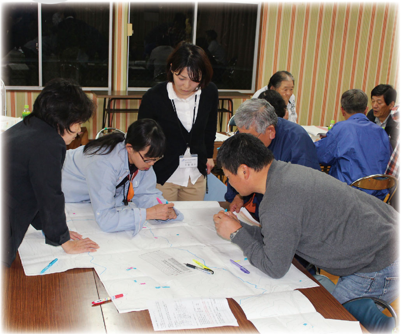
住宅地図で地域の現状を話し合う関係者 (3ページに関連記事)