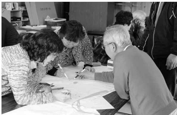
田殿地区社協の見守り会議