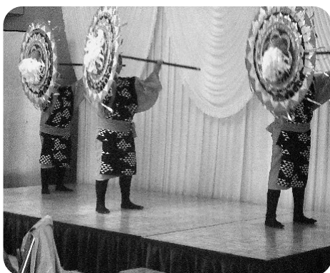
アトラクションを披露する「みまさか優友の会」のみなさん