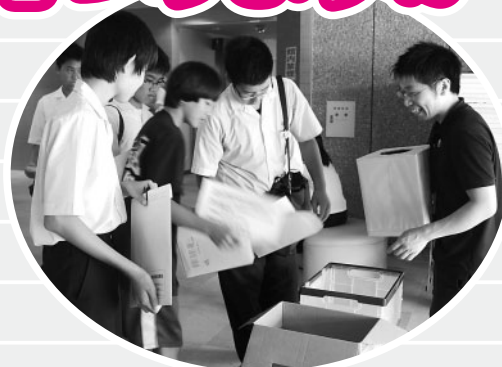
事前研修会での受付をする受講生

美作市社会福祉協議会では、中学生・高校生らを対象に夏休みの期間に「夏のボランティア体験事業」を開催しました。これは、ボランティア活動への理解と関心を深め、さらに活動のきっかけづくりを目的に毎年7月下旬から8月末までの間に福祉施設等や地域でのボランティアの体験をする事業です。