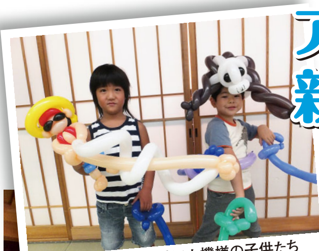
バルーンアート作品に上機嫌の子供たち