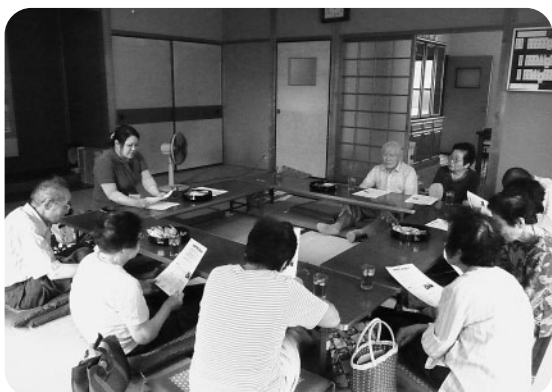
サロン立木 第1回目の様子 「やってみるとわからんけん、まあやってみようや〜」

「サロン立木」では、高齢者の方が家に引きこもるのではなく、近くの公会堂に集まり、生きがいがづくりや社会参加、閉じこもりや介護予防、地域の人の顔つなぎなどを目的に、楽しく気軽に集える場所になるよう、今後も活動を行っていく予定です。