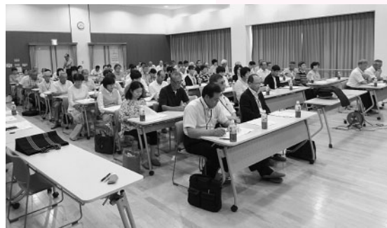
市社協からの事業報告を聞く民生児童委員

事務長制度の設置や会計、編集委員の選任が行われた。◆「おたがいさまネットワーク事業」への取り組みで、多くの地区社協、福祉会議で生活・福祉課題への対応は見守り声かけ活動が基本として「おたがいさまネットワーク事業」への事業展開がなされた。「おたがいさまネットワーク事業」の実施状況で平成26年度実施地区社協は、31地区社協のうち20地区社協で実施され、第1回の見守り会議は17地区社協で既に開催され、現在30名の利用者宅へのふれあい訪問が行われていること。また、訪問活動も重要であるが、見守り会議でマップを見ながら一軒ずつ情報共有し、抜け洩れのないよう支援していくことも重要であると報告しています。