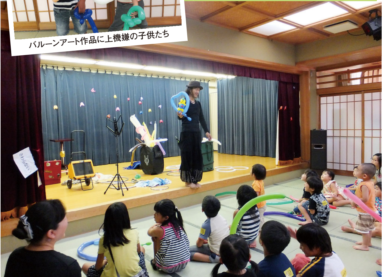
大道芸人のチャーリーさんのショーを楽しむ親子