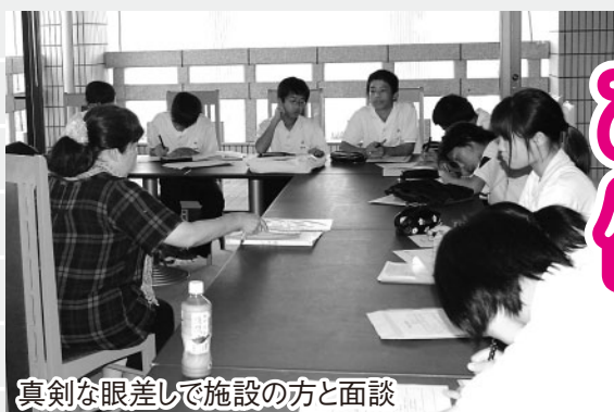
真剣な眼差しで施設の方と面談