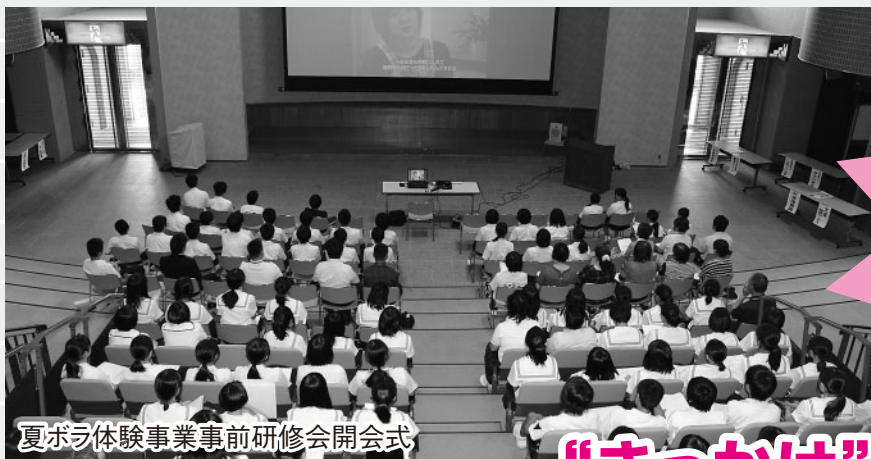
夏ボラ体験事業事前研修会開会式