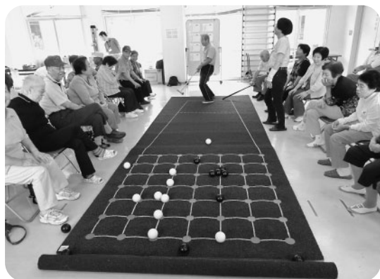
「やったー!五目ができたー!」