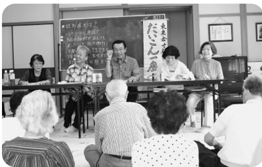
だいきん一座の寸劇、はじまりはじまり～

寸劇の後の座談会では、サロンの参加者から認知症のことを理解し、うまく声かけができる人が、一人でも多くいる地域になれば、助け合いができて、安心して生活できると話されていました。 「ふれんどの会」の皆さんには、これからも東栗倉地域の認知症サポーターとして、頑張っていたきたいと思えます。