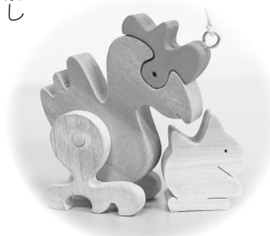
にわとりの親子を作りました