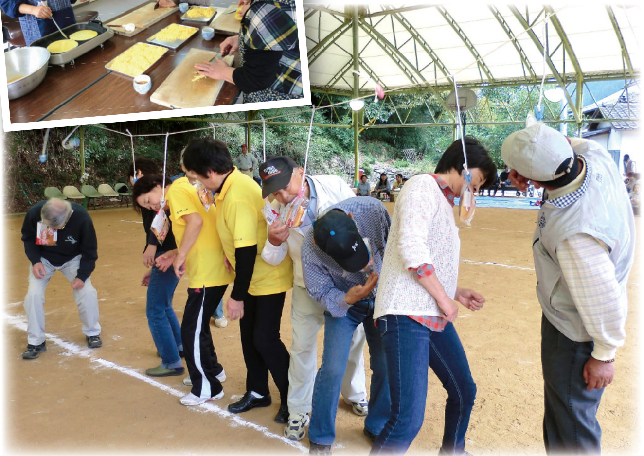
パン食い競争に夢中の参加者の皆さん (於: 河会コミュニティドーム広場)

社協だよりは、皆様からお寄せ頂いた社協会費・寄附金の一部を使って発行しています。