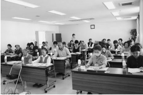
美作市地域福祉計画・消費者被害防止の研修

ふれあい訪問員には、訪問とあわせて、利用者の方の状況を見守り会議に伝える役割も担っています。そのことにより、ふれあい訪問員だけでは対応できないような支援などは、地域