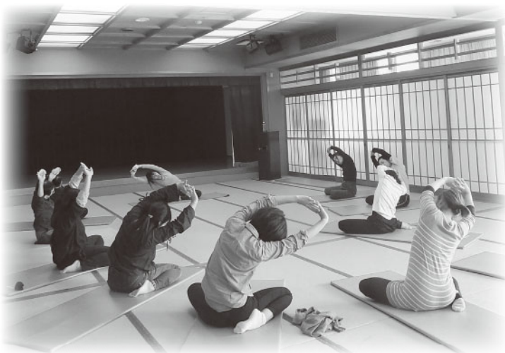
運動不足解消にヨガで体をほぐす参加者