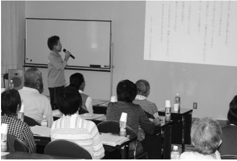
認知症の方の気持ちの「詩」を代読する訪問員

の話をしていただきました。最後にキャラバンメイトによる「認知症サポーター養成講座」では、「認知症の方がどうして同じ話を何度もするのか？」など認知症の方の不安な思いや、その家族の方の気持ちなど、認知症について学び、認知症の方への訪問の際の対応方法などについて学びました。おたがいさまネット事業は、地域の福祉関係者で情報の共有をし、ふれあい訪問の実施世帯について話し合う「見守り会議」と、「ふれあい訪問」が大きな柱となる事業です。