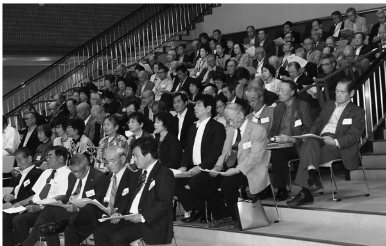
犯罪予防と過ちを犯した人の更生保護の研修を受ける保護司会の皆さん