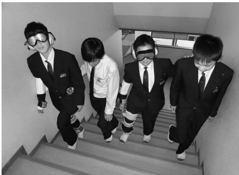
高齢者の疑似体験をする中学生

車いすで段差を越える時や、アイマスクを着けて階段を上り降りする時には、介助される方の不安を取り除くため、しっかり声かけをすることの大切さを実感した福祉体験学習となりました。