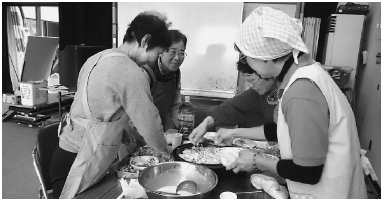
たこ焼き作りを行う参加者「みんなで作ると楽しいわぁ！」

当日は、各サロンから2〜3名の参加者があり、たこ焼き器の設置、材料の用意、たこ焼き作り、片づけ等を、みんなで協力して行いました。「たこ焼きをひっくり返す作業は足が悪い人でも手伝ってもらえそう」「これならうちのサロンでもできる」など、さっそくサロンで活用する計画を立てている参加者もいて、たこ焼き作りのコツをマスターしつつ、各サロンの情報交換も楽しくでき、有意義な研修となりました。