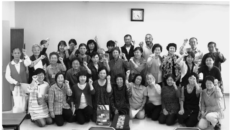
認知症サポーターの証オレンジリングを手に記念撮影