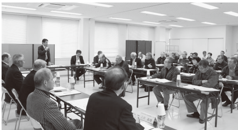
萩原市長の話に熱心に耳を傾ける地区社協関係者