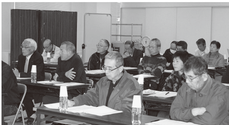
市社協より報告を受ける市内地区社協会長

なります。また、世帯数等の調査結果は地区社協助成金や社協会費交付金事務費に反映されることになりました。友愛訪問支援事業では、配布物を従来の「野菜ジュース」に「スポーツ飲料」「抹茶葛湯」の2品目を加えたこと、サロン備品整備助成事業では、サロン活動助成事業を申請するサロンで、レク用具やラ