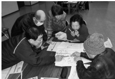
住宅地図で安否確認をする関係者(写真左は大野地区、右は大原地区)