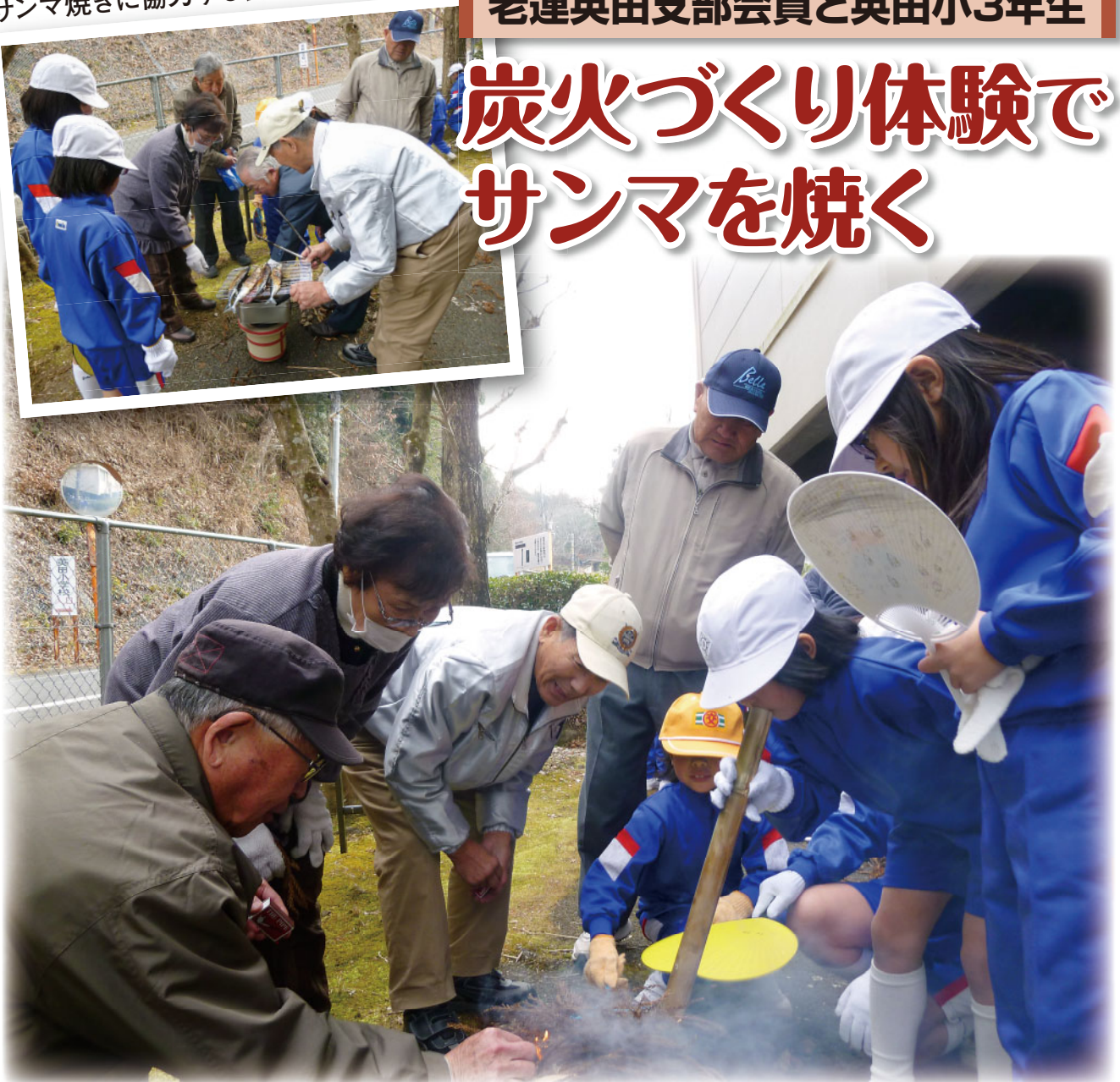
火吹け竹で風を送り、火をおこす子どもら（於：英田小学校）