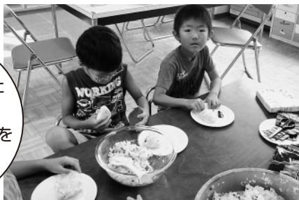
楽しみにしていたランチデー! みんなでおにぎりを作りました。