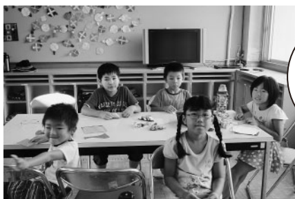
七夕飾りを作ったよ!

今後も保護者・地域住民のみなさんと連携を図りながら、働きながら子育てをする家庭を支援していければと思っています。