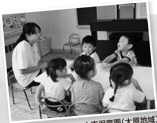
大吉保育園(大原地域)

本年度は、中・高校生約150名の参加があり、市内の高齢者施設や幼稚園、保育園等41カ所の受入施設でボランティア活動を体験しました。 子ども達は、活動をする中で、「笑顔で話すことができた」「声を掛けていただけて嬉しかった」等の多くの感動や充実感、満足感、責任感を感じる体験ができたのではないでしょう