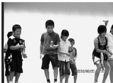
けん玉を披露する子どもたち

また、夏休み中の生活の中では、消防士さんの指導による避難訓練や消火器体験、映画鑑賞、おやつづくり体験なども開催し、家庭では味わえない様々な体験をすることができました。