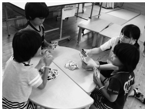
えみっこ放課後児童クラブ(作東地域)