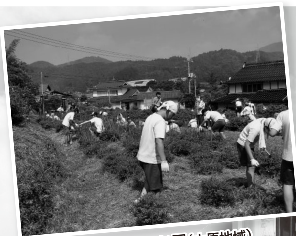
武蔵の里 鎌坂峠つつじ園(大原地域)