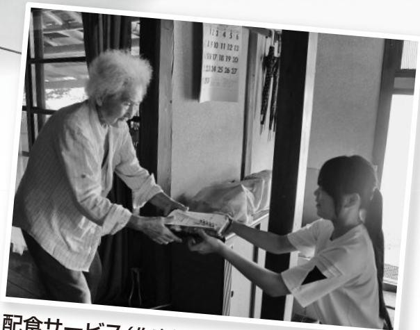
配食サービス(作東地域)