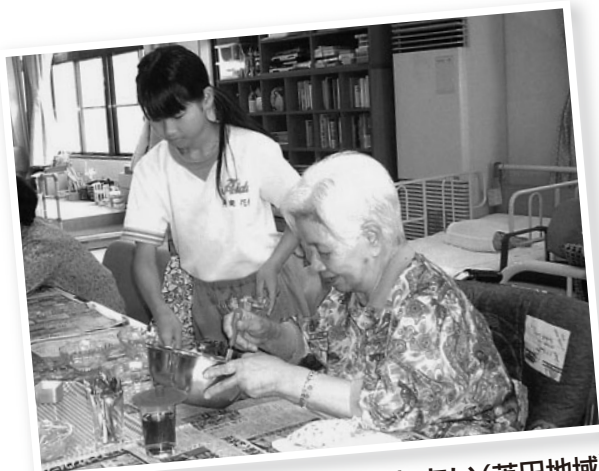
デイサービスセンターふれあい(英田地域)