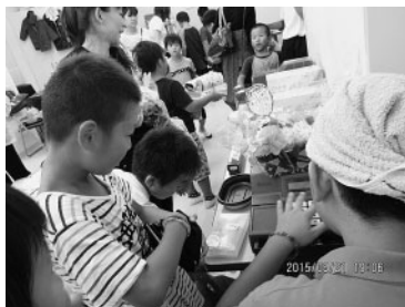
バザーで商品を販売する担当児童