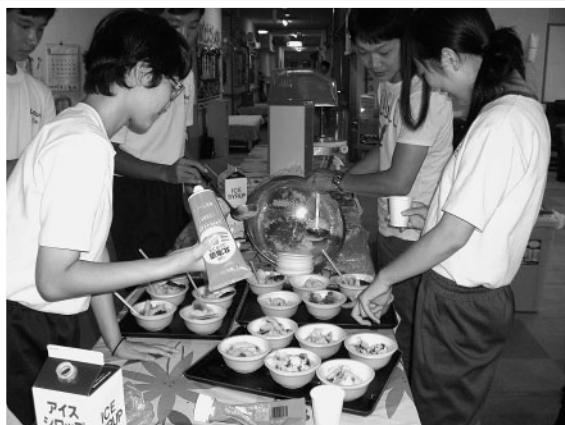
ゆうゆうの里デイサービスセンター(美作地域)

たくさんのことを学びました。常に周りを見ていないと何があるかわからなくて、すごく大変だなと思いました。また、子供たちと遊んだりするだけでなく、水やりやその他いろんな作業も大切な仕事のひとつだと感じました。私は将来保育士になりたいので、すごくいい経験ができてよかったです。頑張って保育士になろうと思いました。