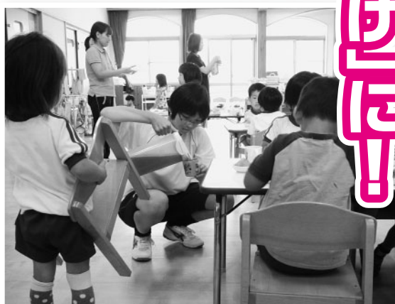
美作北幼稚園(美作地域)