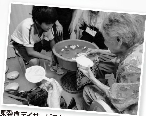
東粟倉デイサービスセンター事業所(東粟倉地域)

美作市社会福祉協議会では、中学生・高校生を対象に夏休みの期間に「夏のボランティア体験事業」を開催しました。これは、「ボランティア活動への理解と関心を深め、さらに活動の「きっかけ」づくりを目的に毎年7月下旬から8月末までの間に福祉施設等や地域でのボランティアを体験する事業です。」