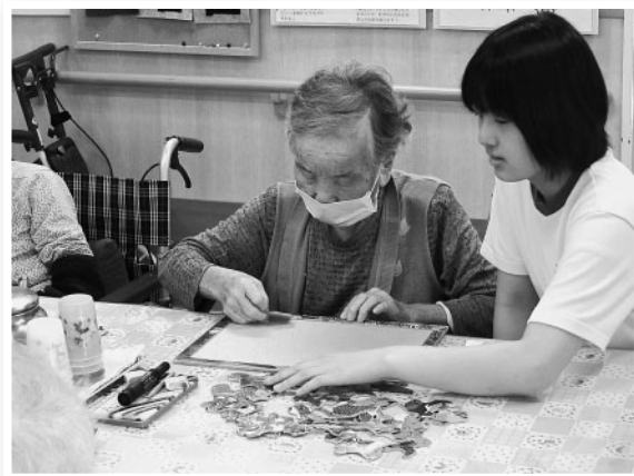
みまさか園(美作地域)