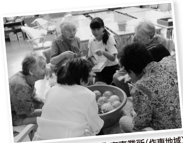
デイサービス作東事業所(作東地域)

2日間という短い時間でしたが、たくさんの体験ができて良かったです。また、介護の仕事をしている母がどれだけ大変であるかも知ることができました。大変であるけれど、私自身このボランティア活動を通して、この仕事がとてもやりがいのあるものだということを実感しました。自分がしたことで利用者の方が笑顔になってくれることにやりがいがあると感じました。