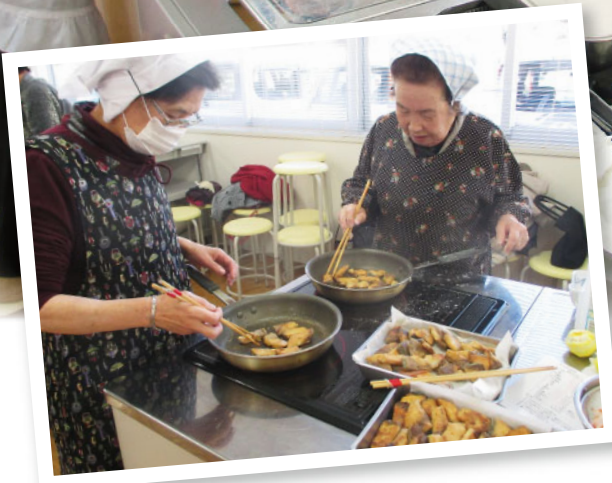
正月気分を味わいながらの料理教室