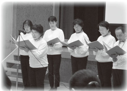
「みまさか朗読の会」のみなさん

美作市ボランティア連絡協議会には33団体、延べ749名が登録しており、市内で様々な活動をしていきます。お互いに連携をとり、情報交換をすることを目的に開催されたこの交流会では、6団体が日頃行っている活動の実践を、スライドを使って発表しました。