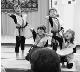
かっこいい「キメ」ポーズを披露してくれました

また、東栗倉総合支所の職員の方によるマインナー制度の説明があり、「知らない人に個人番号は絶対に教えない」ことを確認しました。昼食で交流を深められた後は、介護予防サポーター「ステップの会」による介護予防体操で元気な体作りを学ばれました。参加者の方は「寒くなるけん、気い付けような」「元気でまた会おうな」と次回の開催を楽しみに散会されました。