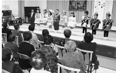
かわいい園児たちに視線は釘づけです