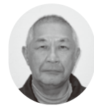
【東粟倉地域社協代表】