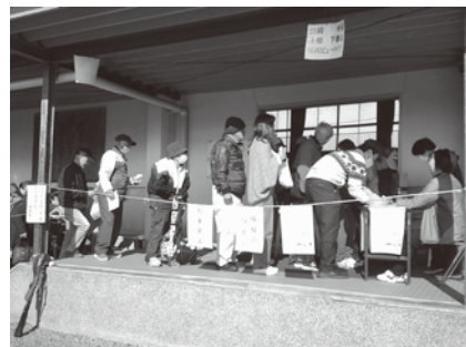
多くの方が参加されました

もち麦イメージキャラクターのもち麦君ときらりも登場。ゲームに参加したり、写真を撮ったりと人気物でした。多くの方が参加され、楽しく交流ができた一日となりました。