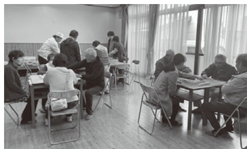
健康麻雀交流会の様子

勝田地域社協では、今後も様々な人が関われるような居場所について検討し取り組んでいく予定です。