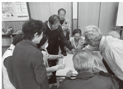
初心者には丁寧にルールを説明!