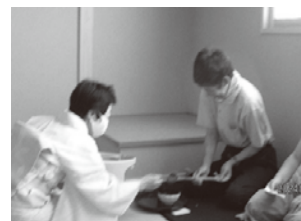
お茶をいただきました