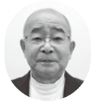
【作東地域社協代表】