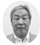
【英田地域社協代表】