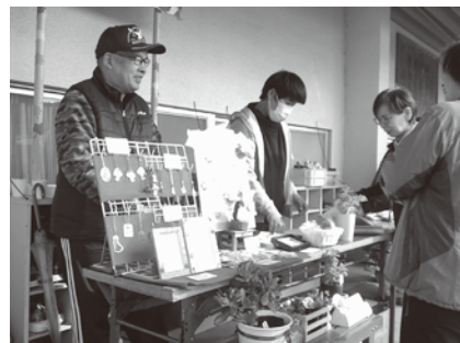
出店コーナーでお客さんと交流